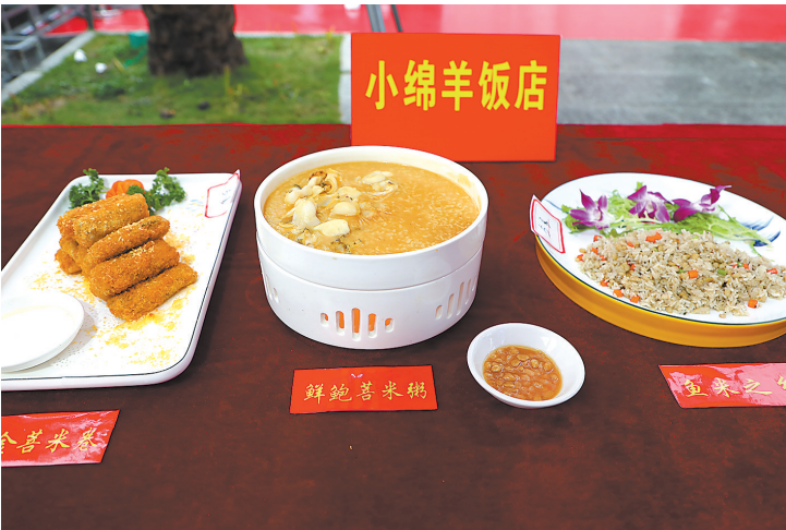
五华菩米美食

据悉,近年来,五华县委、县政府认真落实省委“1310”具体部署和市委工作要求,以做好“土特产”文章为抓手,加大菩米产业挖潜力度,不断提高规模化、产业化、品牌化水平,全力擦亮“五华菩米”名片,助推“百千万工程”。(赖嘉华 曾文敏 曾晓彤)