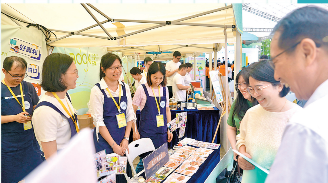
“知也无涯与书有集”全民阅读嘉年华现场热闹非凡

此次推出的书单，涵盖了先进制造、科技创新以及经典文学等多主题的优质图书，充分展现了东莞市“先进制造+科技创新”的城市特色。近年来，东莞致力于完善公共文化服务体系，不断延伸图书馆总分馆建设，以城市阅读驿站为基石，将品质卓越、特色鲜明的阅读空间融入基层，为市民提供丰富的精神食粮。截至目前，已成功建成45个“莞”空间，遍布全市25个镇街。