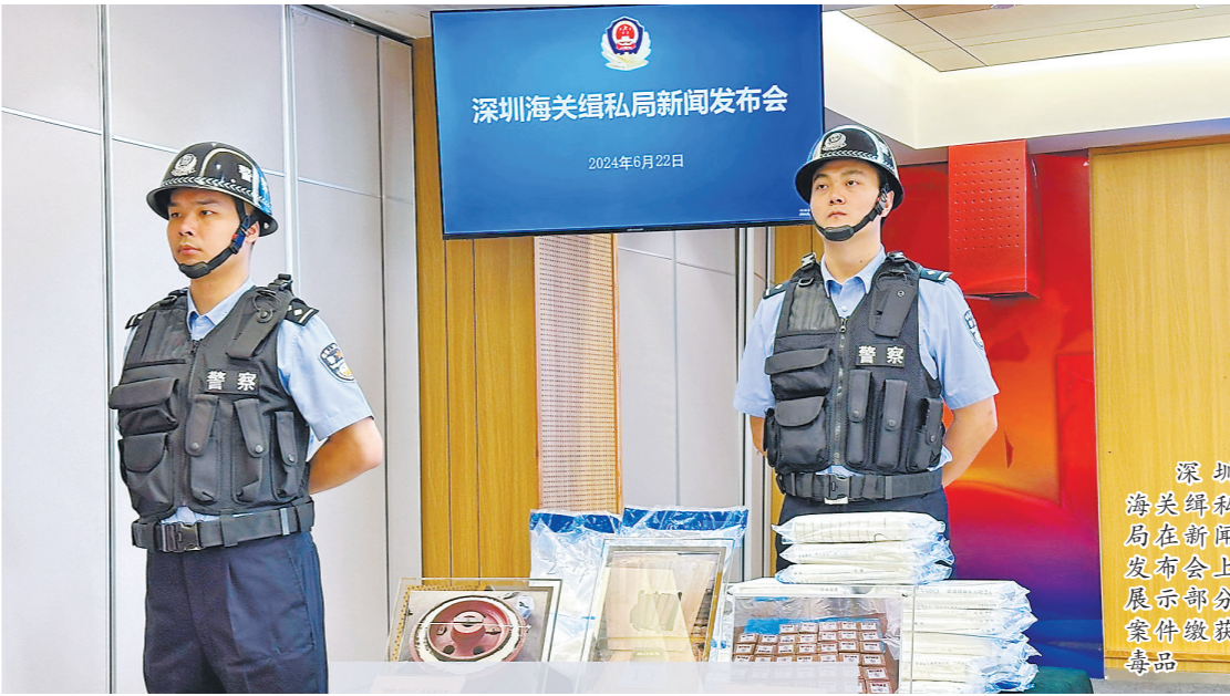
深圳海关缉私局召开“国门禁毒”典型案例新闻发布会

动中表现突出的居民颁发礼品。居民王女士表示，此次禁毒趣味运动会，结合“禁毒+竞技”的形式，让大家在游戏中学习禁毒知识，增强禁毒意识。 凤凰街道相关负责人表示，街道将继续开展内容丰富、形式多样的禁毒宣传活动，引导越来越多的居民参与禁毒中来，争做禁毒知识的宣传者、抵制毒品的践行者，共建平安和谐“幸福里”。（于木子 余勇 李冬冬）