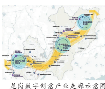
龙岗数字创意产业走廊示意图

推动公共文化供给共享普惠、出新出彩，是龙岗孜孜不倦的追求。每年针对文化服务种类、形式、时间、地点等，通过需求问卷调查、微信公众平台、热线电话等渠道，向市民征求意见，年均举办文化活动1500多场、文化公益培训1.2万课时，让居民不仅是“剧中人”，也可以是“剧作者”。 3月15日，以“美好生活流淌起来”为主题的2024深圳龙岗美好生活节在坂田街道启动。现场发布2024“美好生活之城”活动菜单，100项精选活动涵盖演出、展览、阅读讲座、体育、消费等类型，覆盖2024年全年及龙岗全域。坪地手信、南湾丝绸、园山八景、龙城优品、平湖手信、宝龙有宝……现场设置的“美好街道连廊”，展示龙岗全域11个街道的特色品牌。各街道还共同向广大市民发出“美好生活之城邀请函”。龙岗美好生活节2.0版本以“重塑”的理念进一步擦亮