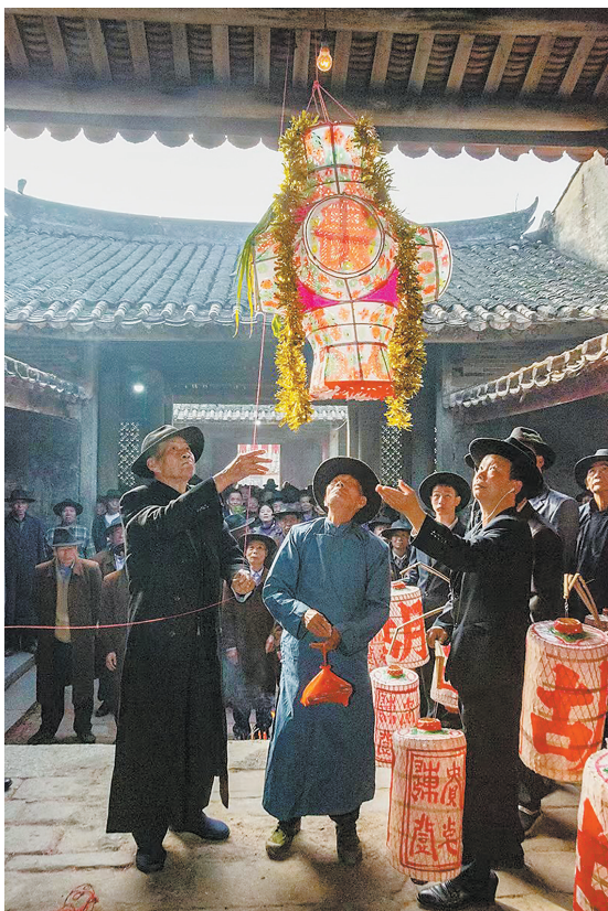
湖镇围“上灯”仪式隆重,反映出胡氏后人 崇宗敬祖、慎终追远之心