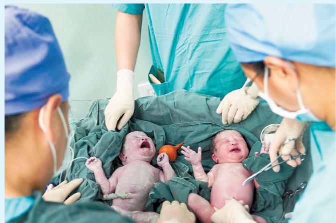
两名5.2斤的女婴顺利出生，母女三人平安