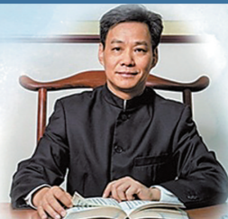
广州中医药大学副校长、广东省中医院院长 张忠德教授