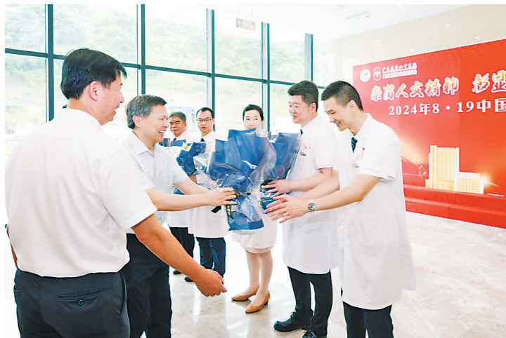
广东省卫生健康委看望慰问一线医务人员