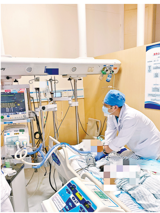
广东省人民医院，凌晨3点的急诊科