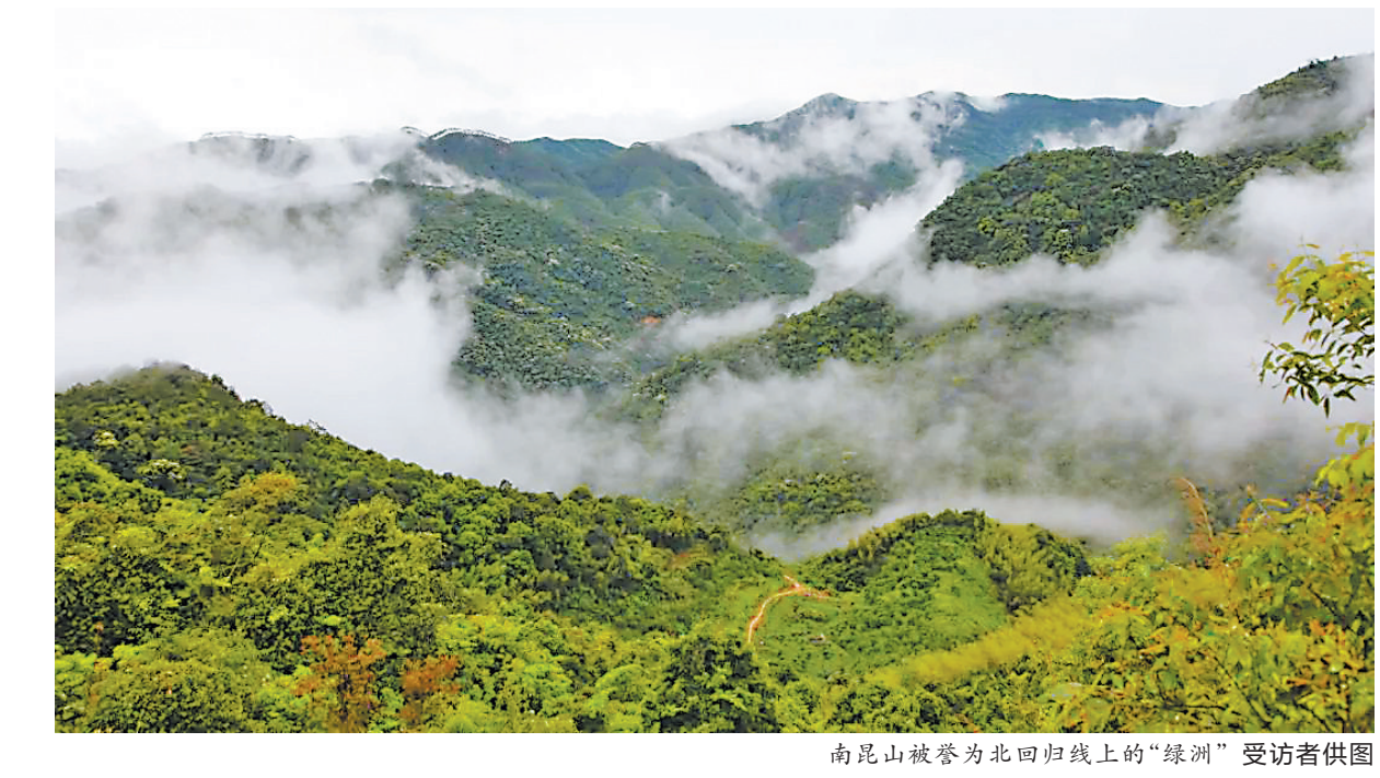
南昆山被誉为北回归线上的“绿洲”