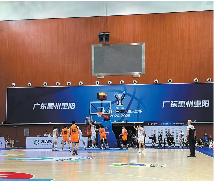
一场又一场篮球赛事在惠阳举办，群众热情被点燃