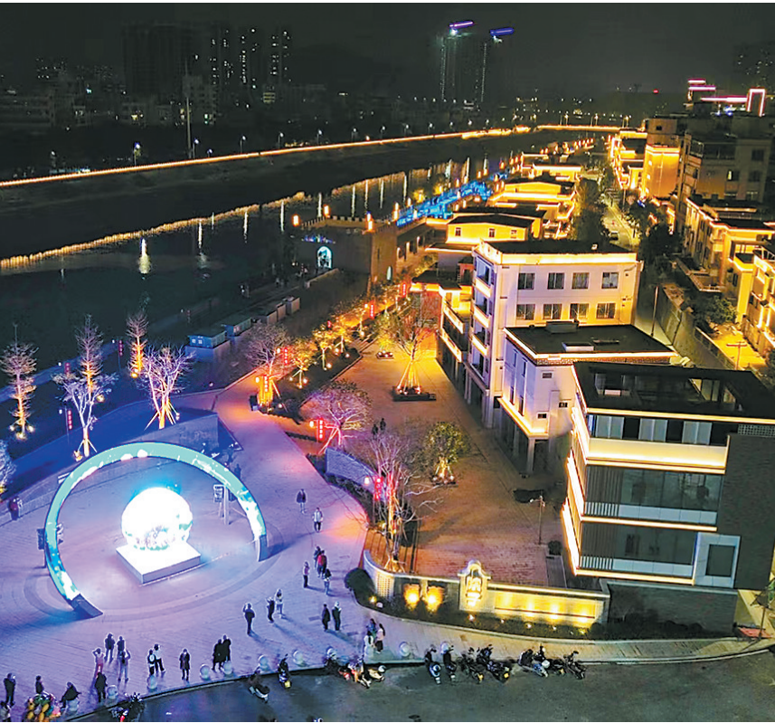
改造后的坝尾社区，灯火通明

2025年广东省政府工作报告明确指出，要丰富高品质文化供给，完善城乡一体的公共文化服务体系，惠阳正以只争朝夕的奋斗姿态，推进这一体系建设。