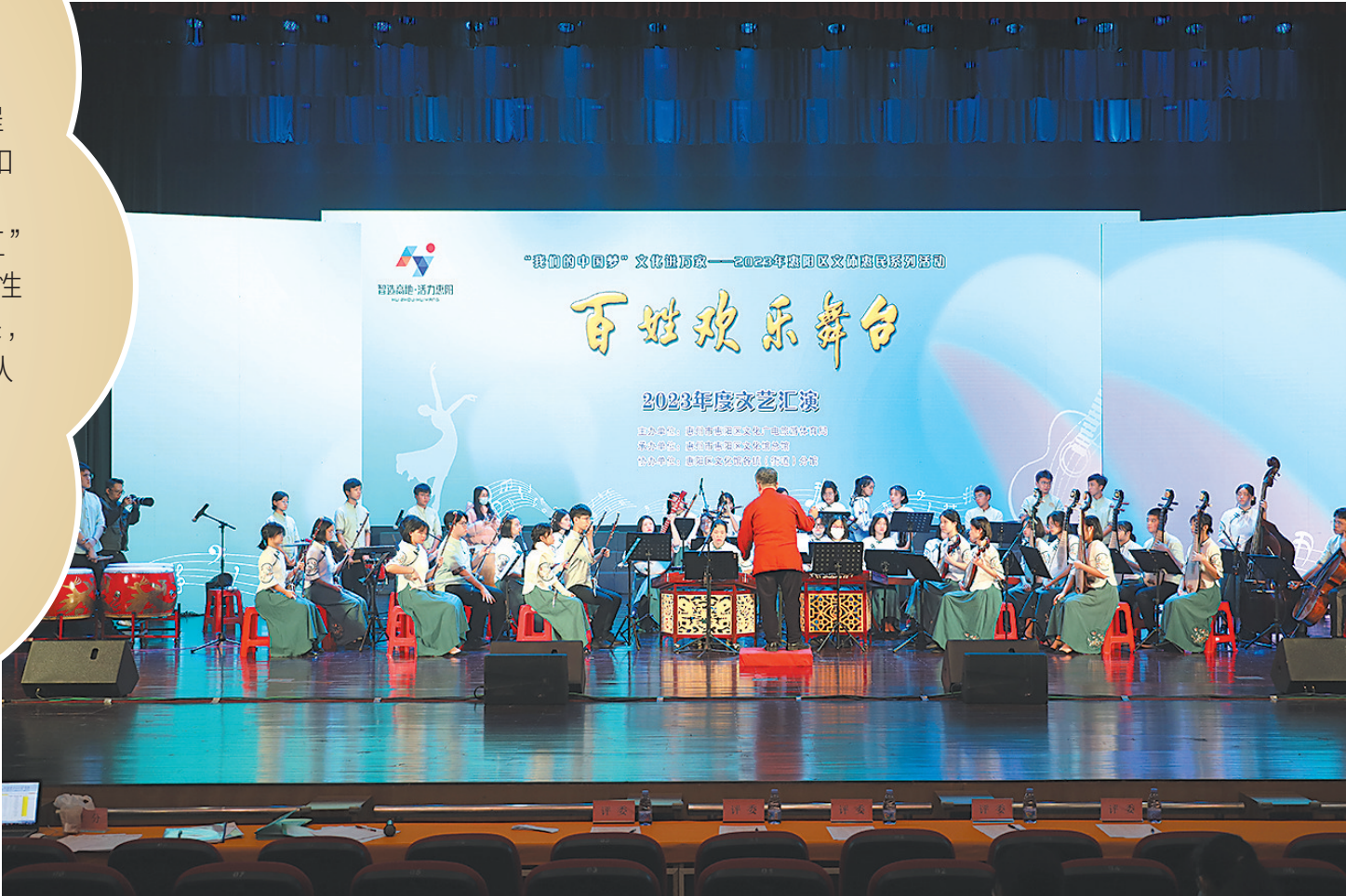
百姓欢乐舞台上，节目均由群众自编自导自演

“百姓欢乐舞台”、惠阳春晚、村BA、粤港澳大湾区吉他文化艺术展演……“十四五”以来，惠阳建立了由政府主导、部门牵头，全社会共同参与的“文体+健康+X”模式，惠阳人民群众精神文化需求、全民健身需求实现了“有没有、缺不缺”到“好不好、精不精”，他们用文化自信、“运动自由”编织着“新乡愁”，印刻下“新记忆”。