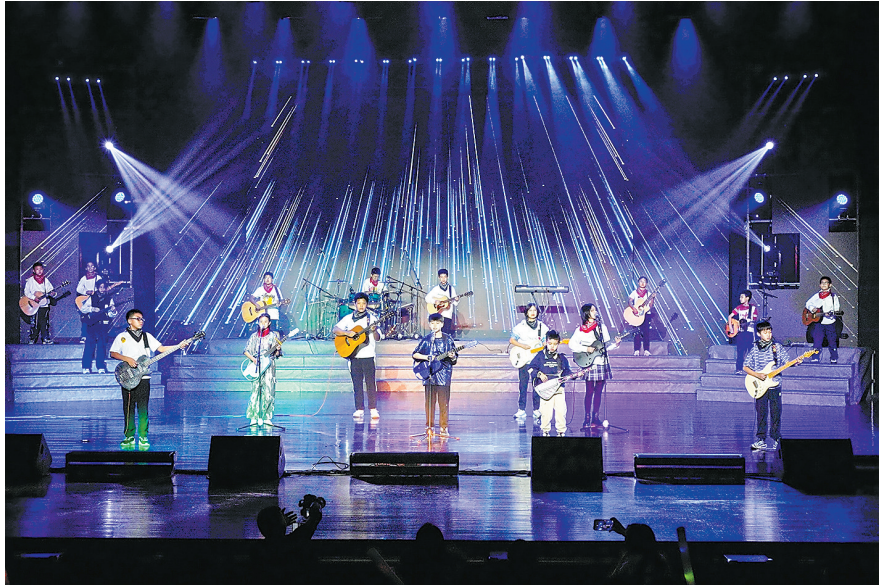
第三届粤港澳大湾区吉他文化艺术展演现场

在惠阳，文体融合的盛宴仍在不断上演。2025年新春期间，惠阳将持续开展“请到惠阳过大年”系列活动，聚焦文化惠民，围绕“逛集市、赏民俗、看展览”等多元化新春消费场景，举行AI科技光影秀、新春长跑、新春篮球赛、运动奇趣闯关惠阳站、公开赛等30余场丰富多彩的文化旅游体育休闲活动，助力“百千万工程”走深走实，彰显惠阳惠阳新魅力，持续带动新春消费热潮。