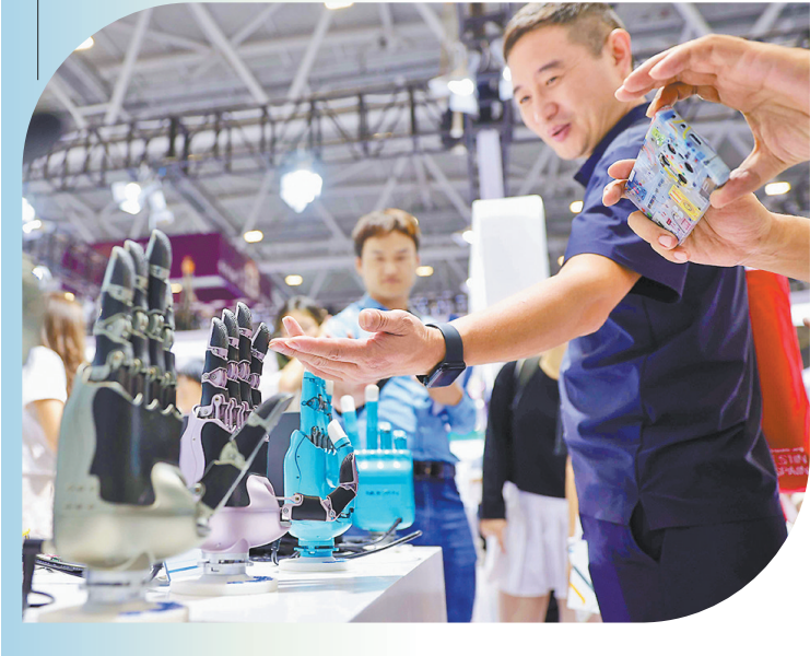
▲深圳加快打造人工智能先锋城市 ▼深圳具身智能机器人关联产业发达

3月3日，深圳市密集出台《深圳市加快打造人工智能先锋城市行动计划（2025-2026年）》等四项重磅文件，按下“AI+”产业发展加速键。未来两至三年间，这座城市将以“建成具有国际影响力的人工智能先锋城市”为坐标，围绕产业升级、技术创新、主体培育三维发力——通过力争打造千亿级具身智能机器人生态链、万亿级人工智能终端产业集群、千家高成长性瞪羚企业矩阵，构建从核心算法到终端产品的全链条创新生态，加快打造具有全球重要影响力的产业科技创新中心。