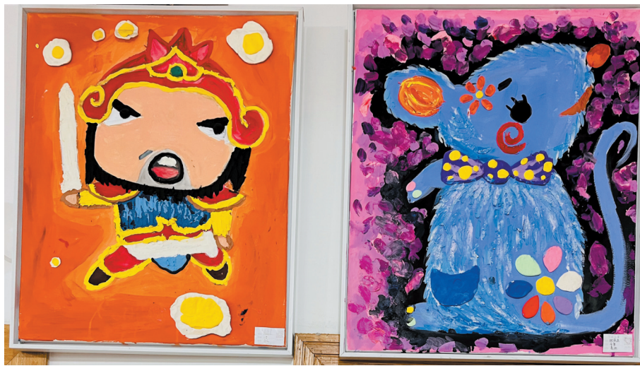
画室摆放着许多孩子捏出来的泥塑作品

庄敏介绍，自广东艺术师范学校毕业后，一直从事美术教育。在教孩子们美术课程时，发现泥塑对于帮助孩子们理解立体物体的结构及其透视变化规律具有显著效果，于是将泥塑引进教学课堂，通过手工泥塑进行造型训练。“后来，为了将泥塑传承下去，遂将传统泥塑与油画相结合，以泥巴为原材料，通过油画的表现手法，创作出独特的泥塑画作，并命名为手塑油画。”