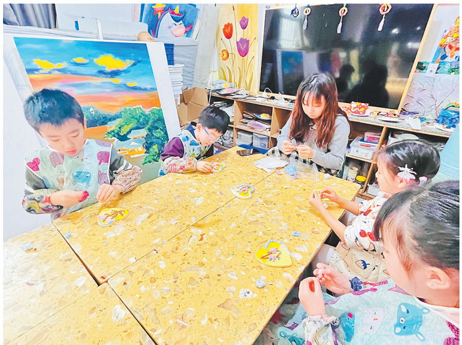
画室里，小朋友正全神贯注地投入到泥塑制作中