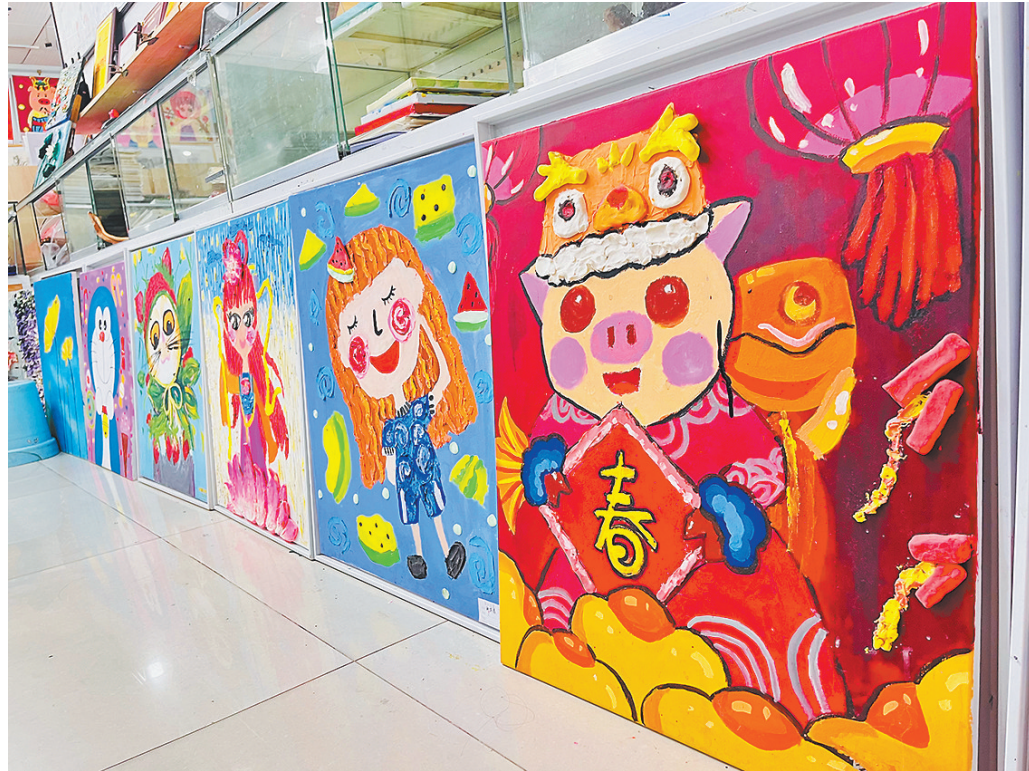
画室小朋友凭借自己的想象力创作出的泥塑作品，每一件都透露出孩子们花费的心思