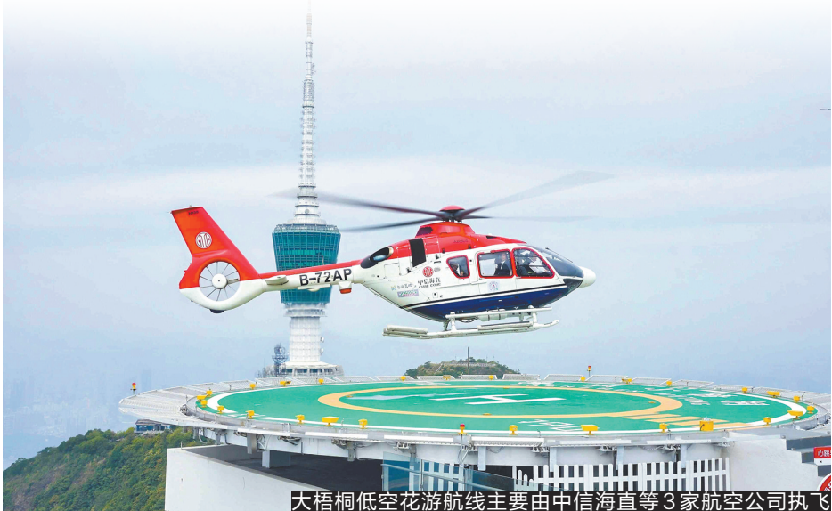
大梧桐低空花游航线主要由中信海直等3家航空公司执飞