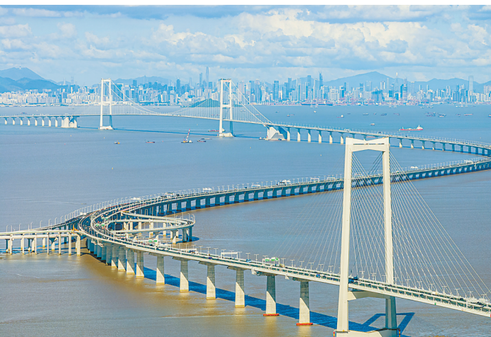
车辆行驶在深中通道上

今年第一季度,创新之城深圳甩出“王炸”。日前,深圳公布的2025年的工作安排中提到,将加快开展深珠通道等项目前期工作,服务建设环珠三角“黄金内湾”。