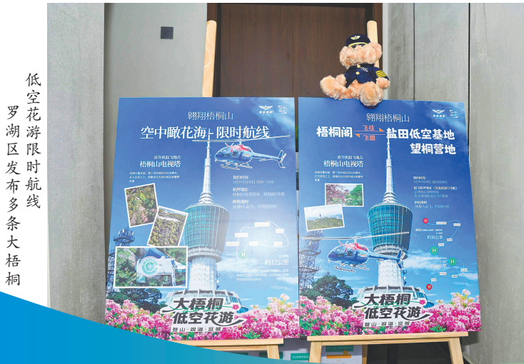
低空花游限时航线 罗湖区发布多条大梧桐