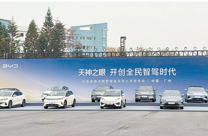
比亚迪去年业绩抢眼

今年以来,比亚迪在电动化与智能化领域连出大招,让其在新一轮汽车产业变革中牢牢掌握主动权,为未来几年的业绩增长打开空间。这也是比亚迪股价持续上涨的重要原因。