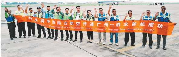
南航开通中国内地首条直飞印尼泗水航线

广州—泗水直航航线的开通,不仅为两国经贸往来和文化交流搭建起全新空中桥梁,也以民航力量书写双边友好合作的新篇章。