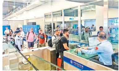
入境外国客商不断攀升

国家移民管理局4月15日发布最新数据，240小时过境免签政策实施以来，全国各口岸入境外国人921.5万人次，较去年同期增长40.2%。其中，免签入境外国人657万人次，占71.3%。