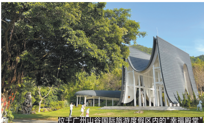
位于广州山谷国际旅游度假区内的“幸福殿堂”

拼假出行已成为近年来小长假前备受热议的话题。今年“五一”假期，“请四休十”的拼假方式广受青睐。