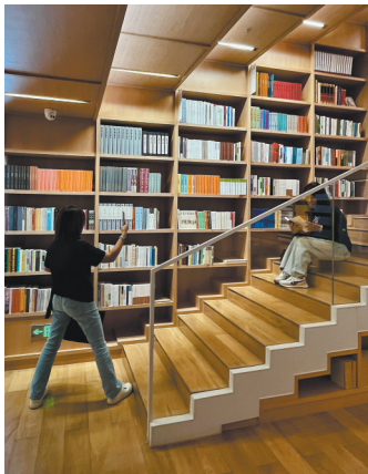
春阳台文化活动空间成为网红打卡点

在去哪儿平台上，购买高铁车票选择“靠窗”座位的旅客预订量同比增长三成。如：湖南张吉怀高铁穿行于武陵源峰林绝壁间，云雾缭绕如仙境，游客可坐卧观赏张家界奇峰怪石和湘西苗寨风情；贵州贵广高铁穿越喀斯特峰林和梯田，5月初正值梯田灌水期，阳光下波光潋滟如镜面；浙江杭黄高铁串联西湖、富春江、千岛湖及徽州古村落，一路景色如画，宛若风光大片连续剧……这些都需要一张靠窗的火车票来更好地饱览。