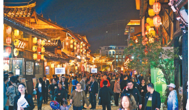
夜游贵州安顺古城

4月10日至12日，以“景城共建、融合发展，打造世界级旅游目的地”为主题的第十九届贵州旅游产业发展大会在安顺市举行。会上发布了贵州文旅数字人“黄小西”、贵州旅游行业大模型、“一码游贵州”3.0版以及安顺“21℃的城市”气象品牌。