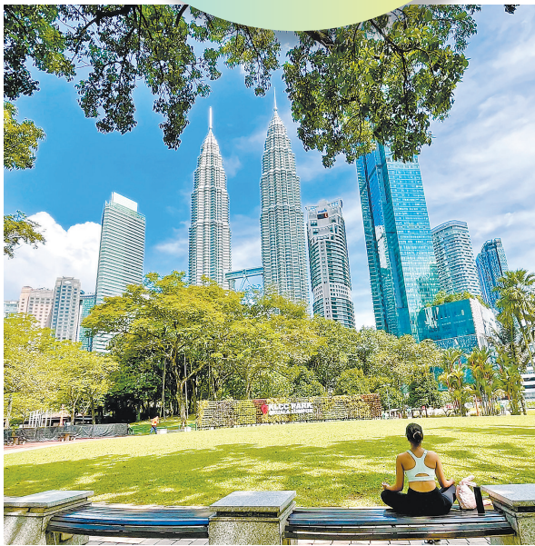
马来西亚吉隆坡感受多样建筑之美

进入4月，东南亚地区热点频出，越南、马来西亚、柬埔寨三国呈现出丰富多样的新态势，备受中国旅游市场关注。记者了解到，上述三国也是广东喜爱的目的地，经典线路经久不衰，新兴线路迭出。旅行社人士透露，今年广州还很可能开通直飞柬埔寨暹粒（吴哥窟）航班，进一步便利与著名世界遗产的时空距离。