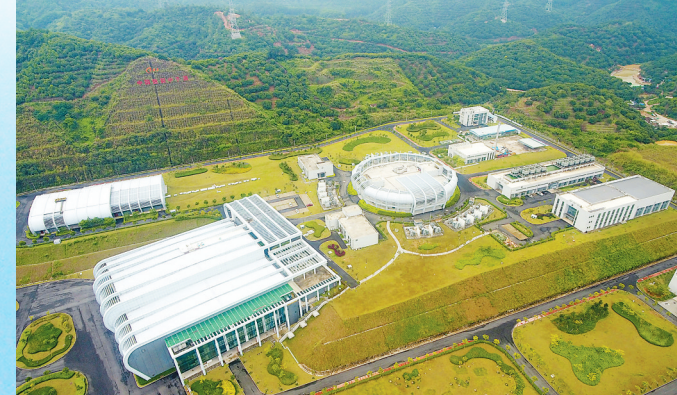
2017年8月，中国散裂中子源成功打靶