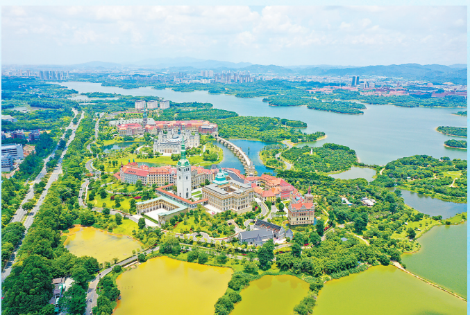
位于松山湖的“华为小镇”已成为东莞的一张名片