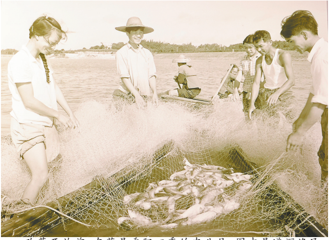
改革开放前，东莞是香飘四季的农业县，图中是道滘渔民捕鱼场景