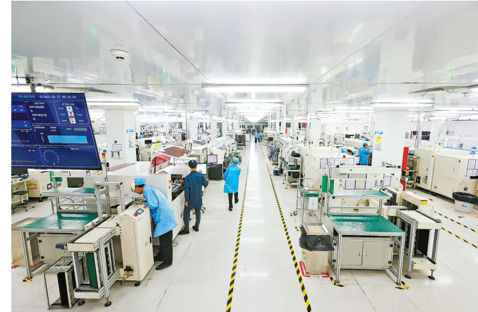
海能电子打造的“数字车间”