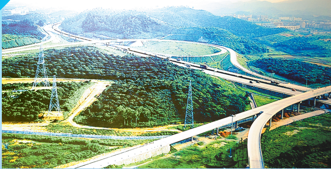
1997年，莞深高速开通，开创全国地级市自筹资金建设地方性高速公路的先河