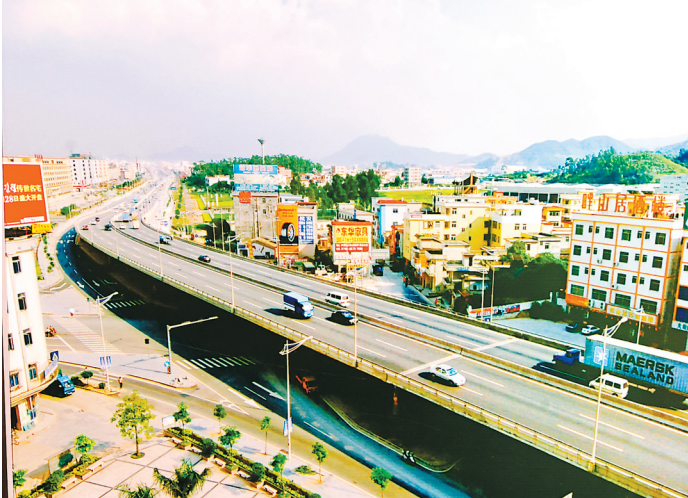
20世纪八十年代末，东莞掀起基础设施建设高潮，到1994年，莞长路、莞惠路、东深路、莞龙路4条主干道和13条联同公路全线贯通