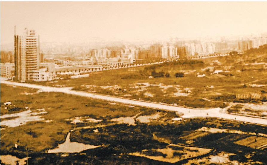
城市中心区建设前

历史的巨笔，总在时代转折处书写华章；奋进的征程，常于风云激荡中开辟新局。四十年前，东莞从农业县的起点启航，借改革开放之东风，以“敢为天下先”的胆识与魄力，铸就了“世界工厂”的辉煌；四十年后，这座城市以“不惑之年”的从容，再次站上历史坐标，以高质量发展为笔，深化改革为墨，擘画迈向国际先进制造业之都的壮丽蓝图。