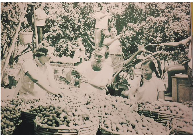
图中是当年荔枝丰收场景