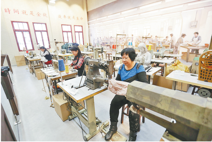
全国首家“三来一补”企业太平手袋厂陈列馆内重现当年生产场景

改革，是东莞发展的基因；开放，是东莞崛起的密码。四十年间，东莞以“先行先试”的勇气，率先探索外向型经济模式，引进全国首家“三来一补”企业，从此开启“世界工厂”的制造传奇。如今，开放格局已从“引进来”拓展至“走出去”，从“加工制造”升级为“全球资源配置”；散裂于乡间、先进阿秒激光设施等“国之重器”落地生根，香港城市大学（东莞）、大湾区大学加速建设，东莞正以“科技创新+先进制造”的双轮驱动，打造具有全球影响力的科创高地。 改革的深度，更体现在营商环境的持续优化。东莞以“数字政府”建设为抓手，推动“一网通办”改革，打造“企莞家”服务平台，实现惠企政策“一键直达”。2024年，A股上市公司新增4家，总量达62家；境内外上市公司总数84家，新三板挂牌企业80家，增量与总量均居全省地级市首位，彰显市场活力的澎湃涌动。