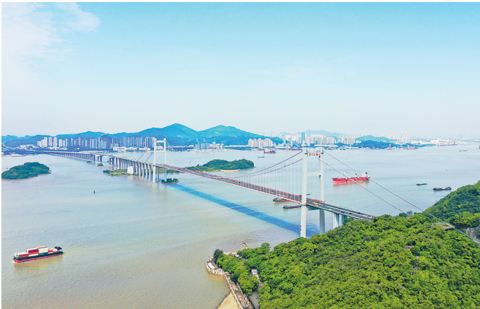
1997年6月9日，总投资达30亿元的国家重点建设工程——虎门大桥正式通车

改革的终极目标，是让人民共享发展成果。东莞在推动经济腾飞的同时，以“绣花功夫”推进城市治理与民生改善：2024年，社会消费品零售总额4446.26亿元，同比增长0.5%，其中家用电器、日用品等升级类商品零售额分别增长61.9%、40.9%；轨道交通1号线贯通主城区，东莞南站、虎门高铁站扩容升级，构建起“四通八达”的湾区“145个儿童友好慢行街区、12个一刻钟便民生活圈”，让“此心安处是吾乡”的温度触手可及。 东莞的改革故事，更是千万奋斗者的共同叙事。从“打工仔”到“新莞人”，从“三来一补”工人到独角兽企业创始人，无数个个体在东莞的包容与机遇中实现人生价值。这座城市，用“海纳百川”的胸怀接纳五湖四海的追梦人，以“厚德务实”的精神凝聚向上向善的力量。