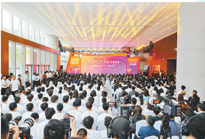
2024年9月2日，香港城市大学（东莞）迎来了首届开学典礼