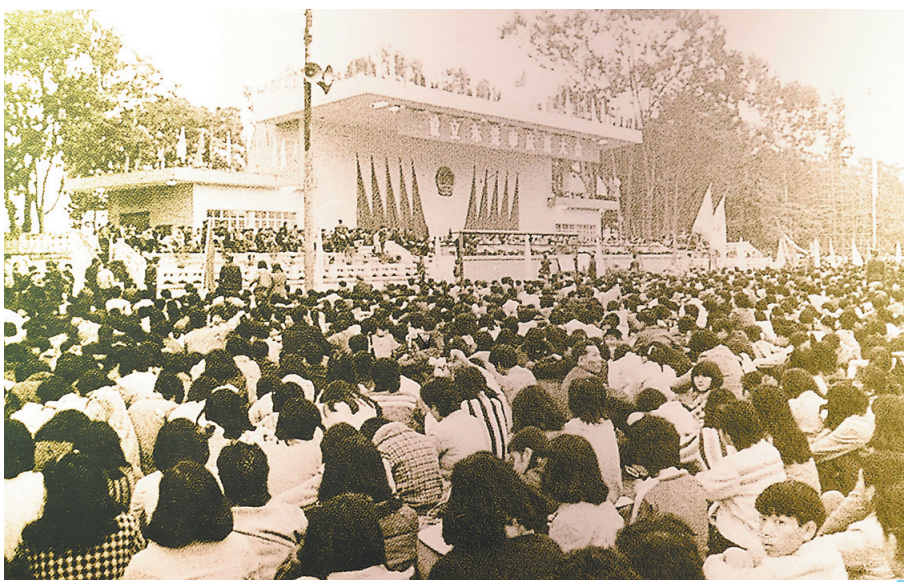
东莞撤县设市庆祝大会