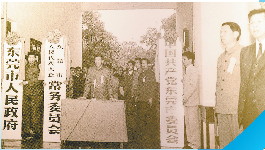
1985年9月，东莞市委、市人大、市政府挂牌