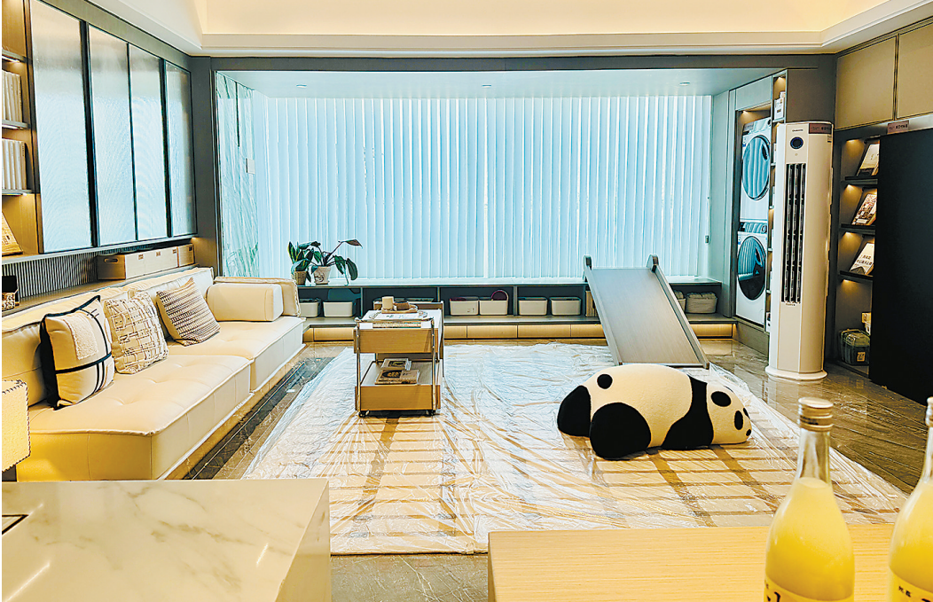
刚需新盘注重精细化收纳设计