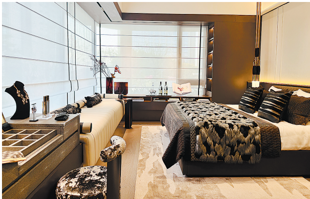
不少新规后的产品在卧室空间加大收纳布局

近期,羊城晚报记者走访广州部分新盘发现,当前开发商正通过精细化设计回应家庭结构变化、空间利用痛点和审美升级需求,构建起“功能+美学”双驱驱动的收纳体系,为广州的居住品质提升注入新的活力。对此,业内人士表示,在“好房子”建设过程中,房屋装修极为重要,收纳作为室内设计方案落地后最直观的体验部分,成为人们的关注重点。广州新房市场正经历从“空间扩容”到“功能提质”的深刻变革,收纳系统作为衡量居住品质的核心指标,已从“加分项”升级为“必选项”。