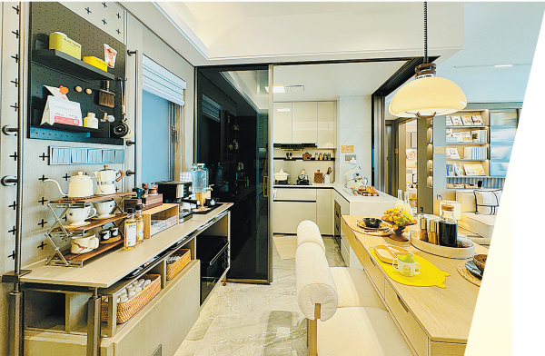
厨房的收纳设计有利于保持房屋的干净、整洁