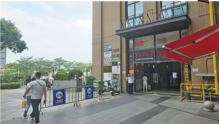
大量酒店式公寓的存在让琶洲新村成为广交会客商聚集地