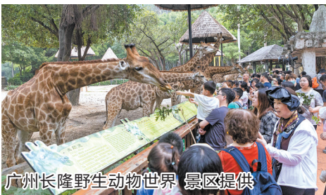
广州长隆野生动物世界 景区提供

广州出发直飞北京最低450元，直飞上海最低354元……还有全国各地知名景区一波接一波的专属门票优惠福利袭来，旅游市场在7月暑假旺季来临前，为高中毕业生们端出了最具诚意的优惠福利。 即将踏入人生新旅程的莘莘学子，千万别错过“一生一次”的薅羊毛好时机，拿好准考证出发！