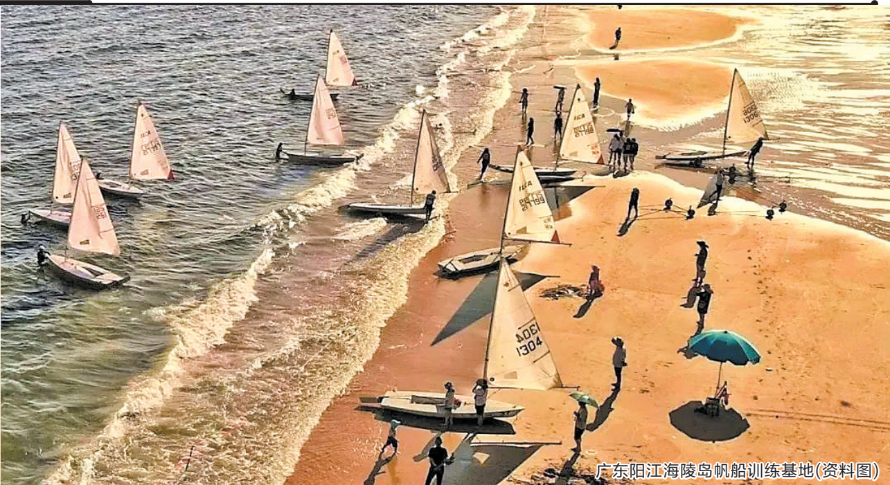
广东阳江海陵岛帆船训练基地(资料图)

本次入选的门头沟永定河古渠灌溉工程历史悠久，鼎盛时期润泽几万亩土地，目前该灌溉工程灌溉农田约2000亩，灌溉遗址、古闸坝、水利碑刻、摩崖石刻等还构成了丰富的水利遗产群。