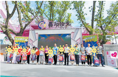
为困境儿童送上福彩“温暖包”

近日,梅州市福彩中心联合当地社区共同为孩子们打造“润心伴成长,同心护未来”系列活动,通过深度推动“福彩+社区”跨界融合,将公益福彩与传统文化相结合,积极探索非遗项目传承接力。