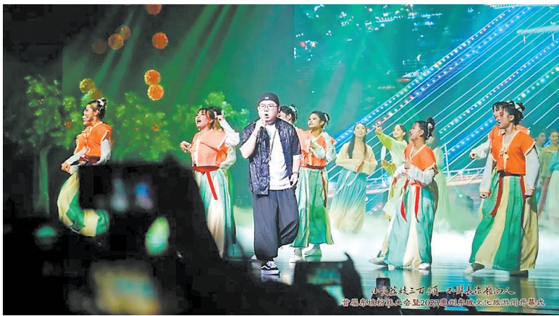
客家话说唱歌手面包星人