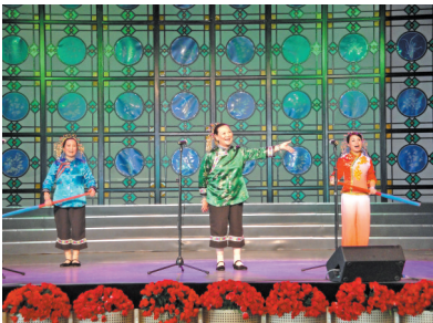
2010年上海世博会上广州周表演节目展演——唱渔歌