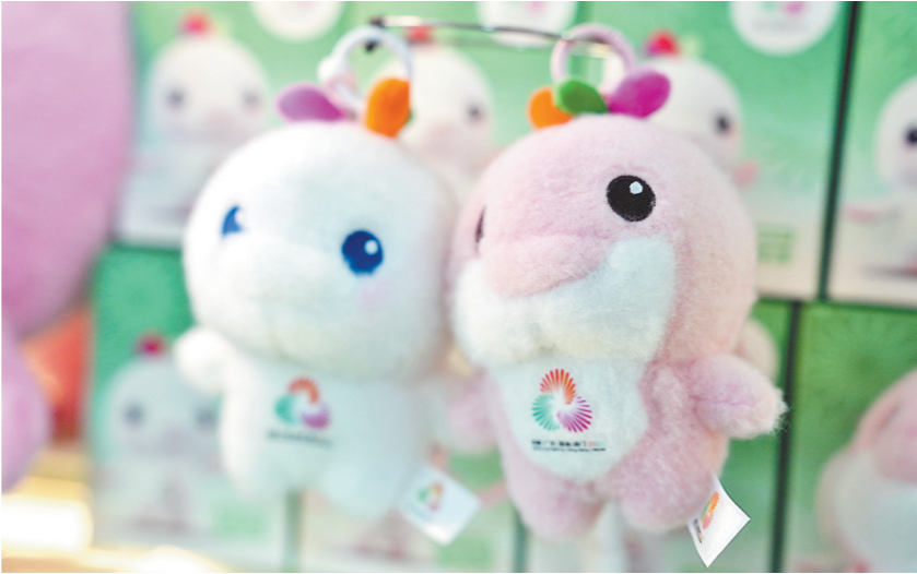
十五运会吉祥物“喜洋洋”“乐融融”

“通过拿到十五运会吉祥物的特许经营权，我们可以根据全运会的高标准要求，推动我们产品质量的提高和开发设计能力的提升。”肖森林告诉记者，接下来，哈一代玩具将借助此次契机，更好地顺应市场的需求，把年轻人喜闻乐见的设计元素