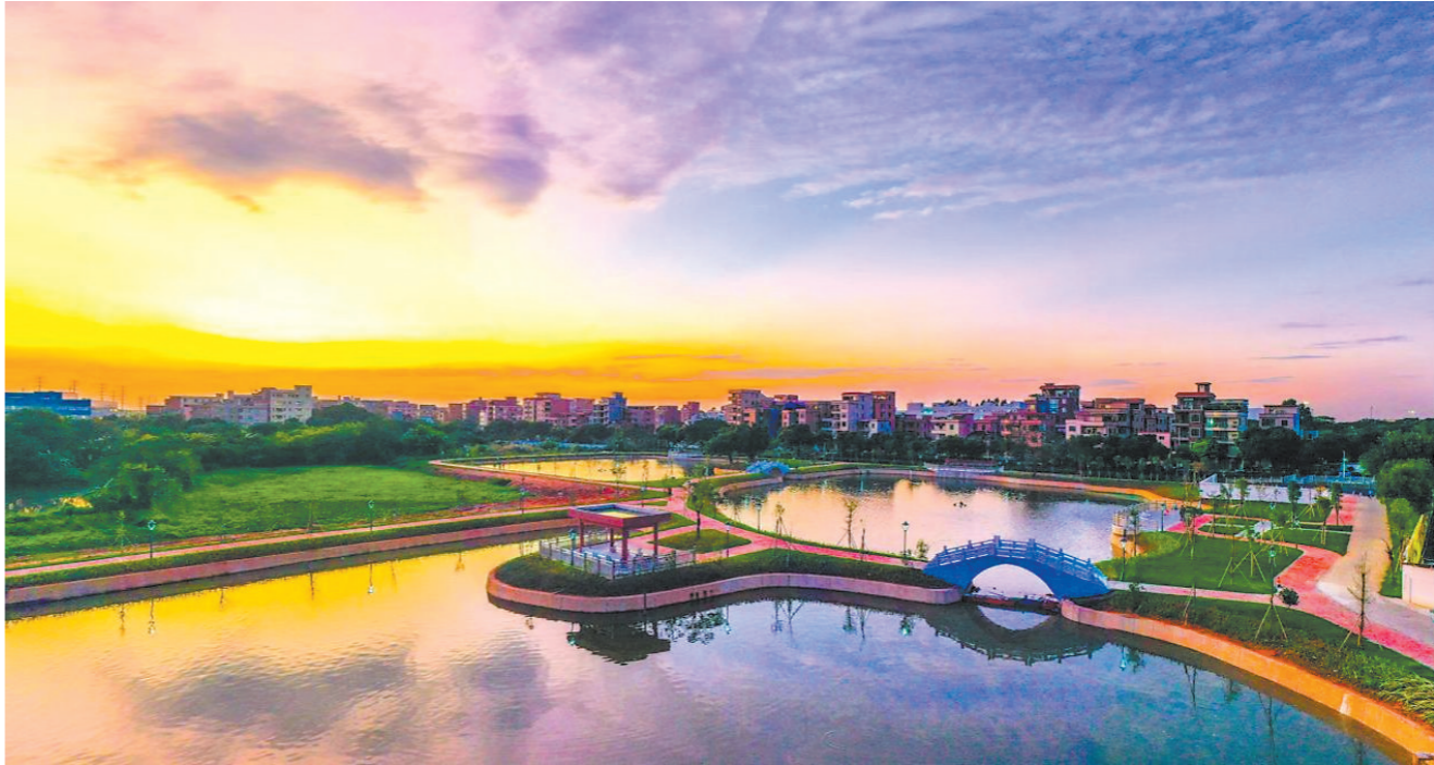
横涌头村秋鹭湿地公园

医疗领域同样亮点纷呈，大型义诊让群众在家门口看上“专家号”，社区中医理疗圈粉年轻人。高埗医院完成医疗大楼升级并获评“中国基层胸痛中心”，社卫中心新增5个中医阁，让群众