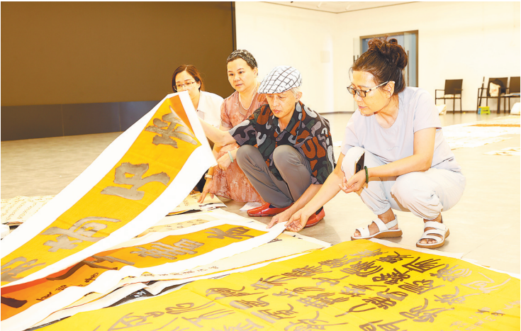
初赛作品评选现场

本次大赛以“书写四十年·笔墨颂东莞”为主题，旨在通过书法这一中华文化瑰宝，引导青少年感悟城市发展脉搏，传承敢为人先的东莞精神。2025年是东莞撤县建市40周年。40年来，东莞从农业县蝶变为“世界工厂”“湾区明珠”，在经济、文化、教育等领域取得了举世瞩目的成就，本次大赛鼓励青少年通过书法艺术展现东莞40年来的发展成就、城市风貌与文化底蕴。