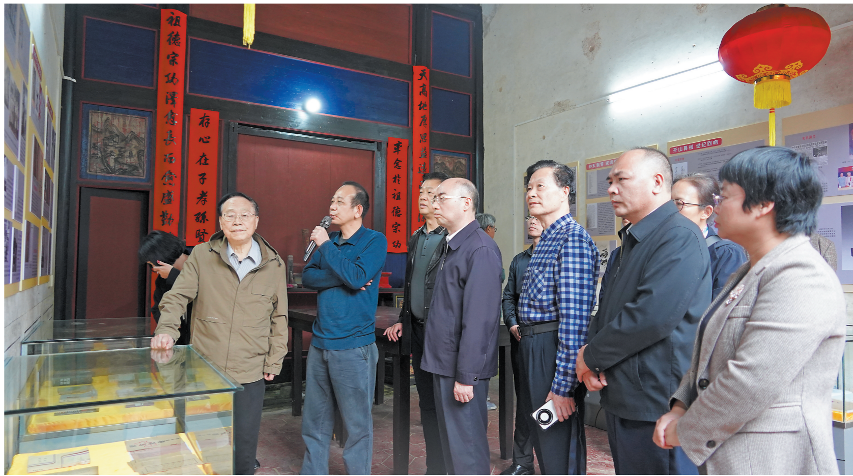
领导嘉宾参观李金发主题展

冬日暖阳里，南国铺开一卷诗意长宣。一场“纪念李金发诞辰125周年”的文化盛宴，恰如一支饱蘸岁月深情的巨笔，自珠江畔的学术殿堂起势，于客家山水间的精神原乡落款，在时间的卷轴上再度勾勒“诗怪”李金发跌宕而辉煌的传奇。这不仅是对一位融通诗与塑、贯穿中与西的艺术巨匠的深情回望，更是一场关乎文化根脉的追寻、跨界智慧的碰撞，以及那永恒不息的薪火如何照亮当代创作的深刻对话。