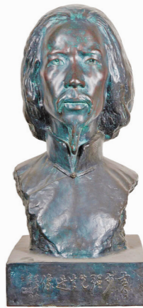
▲李金发雕塑作品:《黄少强像》 资料图

百余年前,西方艺术界被中国人制作的两件花岗岩雕像作品所震撼。创作者李金发——一位来自广东梅州的年轻人,他在旅法期间为同乡林凤眠和刘既漂各做了一个石膏像,并雕刻成花岗岩像亮相巴黎世界艺术博览会展台,最终成为雕塑作品入选法国展览会的中国第一人。