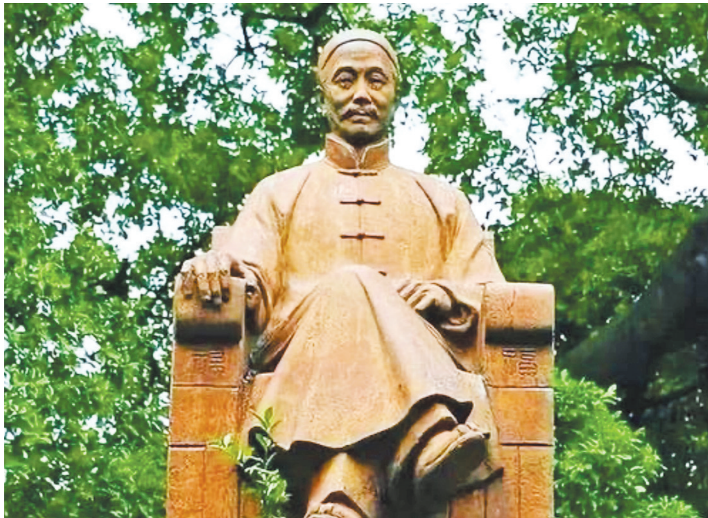
伍廷芳像 作者:李金发 资料图