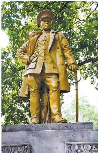
邓仲元铜像 作者:李金发 资料图