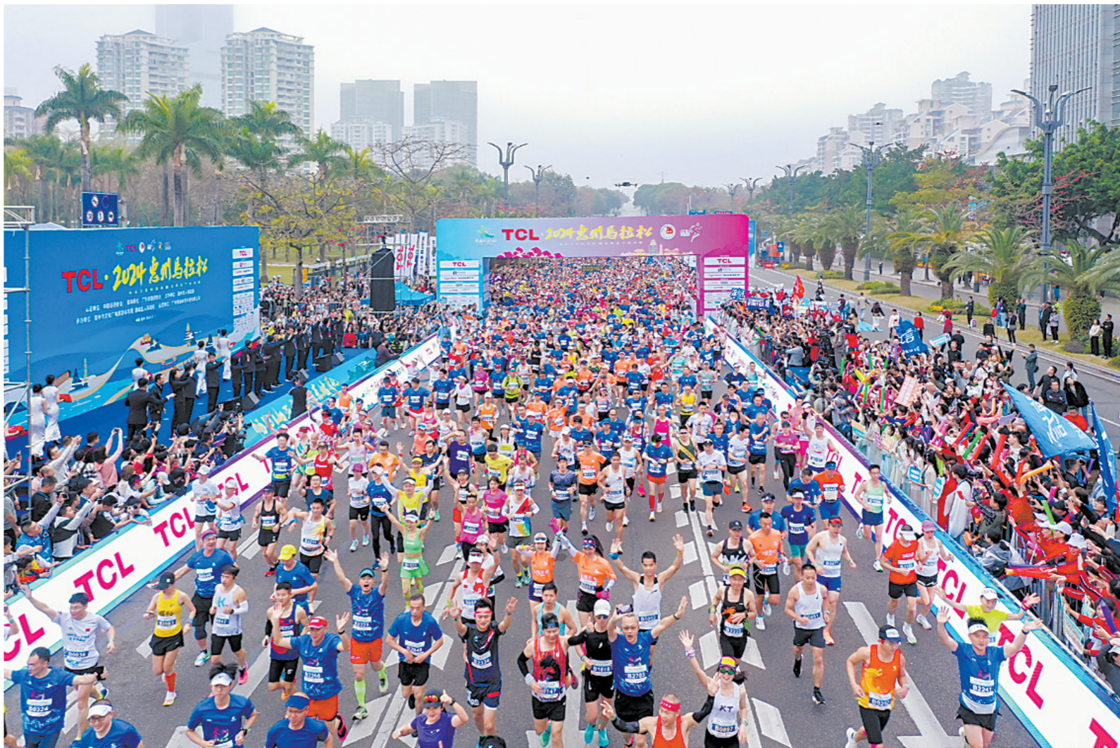
首届惠州马拉松赛事现场(资料图)

据介绍，赛事总规模为1.3万人，其中马拉松项目5000人，半程马拉松项目8000人。赛事设置马拉松项目名次奖、半程马拉松项目名次奖、惠州市民奖，赛事奖励全面升级，公开组奖励名次扩大至前30名，并特别增设“破赛会纪录奖”。赛事将以中国田协A类赛事标准全力打造，届时运动员取得的成绩，可以计入中国田协以及国际田联的马拉松及相关运动的成绩排名，可申报全国、亚洲以及世界纪录。