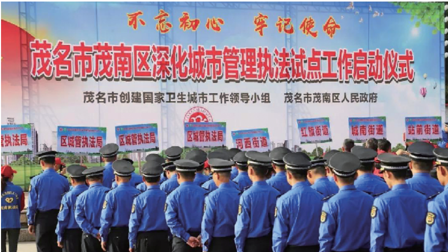
茂南区深化城市管理执法试点工作启动仪式

目前，该局在辖区内全面开展“门前三包”责任制示范街活动，成功打造了“门前三包”工作亮点。为激励落实“门前三包”责任制，区政府定期组织开展示范街考核评级，相应发放奖励金。截至2020年10月，全市各街道至少建成一条“门前三包”示范街，共派发“门前三包”宣传单张约20万份，制作“门前三包”大型宣传栏8个、“党建+双创”“党建+创卫”宣传牌240个，安装“门前三包”责任牌2.5万块，共投入资金约356.5万元，全面提升市区市容环境卫生水平，相关做法被“学习强国”平台推广。