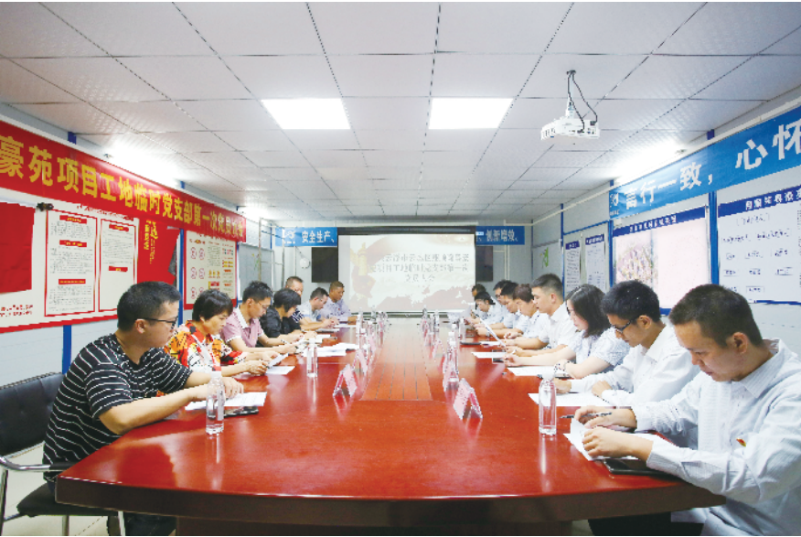
云浮市首个在建项目临时党支部成立

今年年初，项目部接到特别紧急、重要的任务——钧粤豪苑营销中心、样板房开放以及园林展示区配套完善，现场有很多地方需要完善，且时间紧迫。任务进行期间，现场每天都像打仗一样，参与的人员、协调的部门、接受的指令都很多，但大家都激情高涨。在党员的先锋模范带头作用影响下，项目部没有一个人员请假，都坚守在自己的岗位上，毫无怨言，一直到活动举行的前一个晚上，大家还加班到凌晨两点，当时，有一个项目管理人员累得直接瘫睡在了顶板厕所前面的台阶上。最后，在政府、集团、公司总部等多个主管部门的支持与指导下，在临时党支部的带领下，项目部团结一致、不怕困难，按时保质完