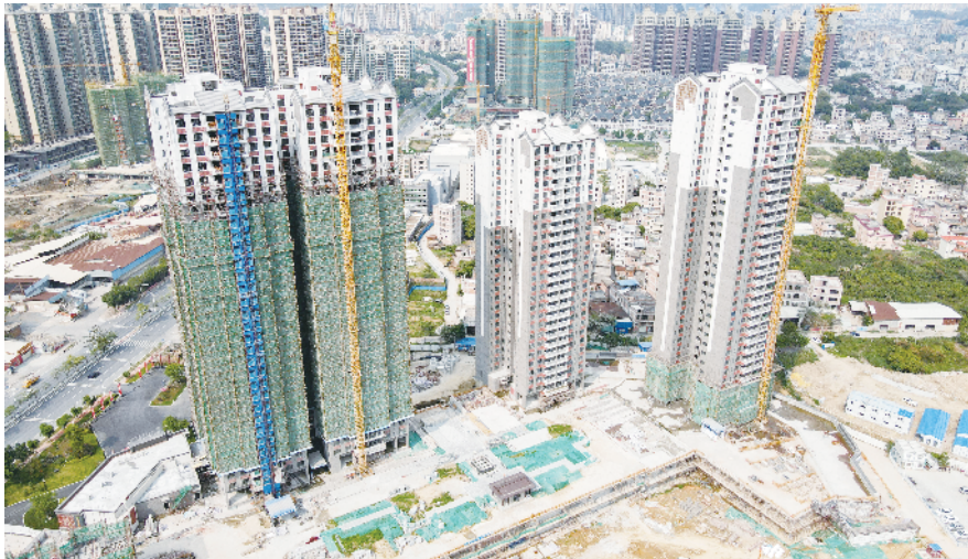
在建中的翔顺钧粤豪苑项目