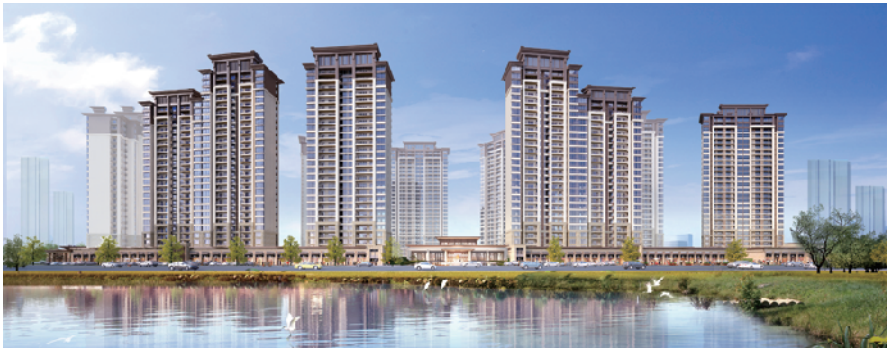
中海阅湖壹号效果图

2019 年中海地产首进清远，历经 44 轮激烈举牌最终以 4524 元/平方米的价格摘得清远市飞来湖区域 18 万平方米一线湖景项目。中海地产秉承“我们经营幸福”的使命，努力为清远人民带来不一样的幸福生活体验，以“中海壹号系-中海阅湖壹号”礼献清远。