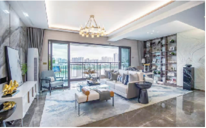
中海阅湖壹号精装修样板房

立足品质至上的壹号系，更是中海系列产品中让人仰望的高端品系。非拥有核心资源不称壹号，非高端产品不称壹号，一座城市只能有一座壹号系。42 载品质沉淀，中海开发的壹号系也只有 22 座，您值得拥有。