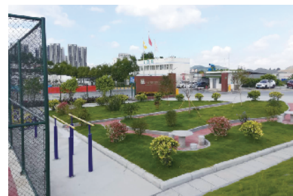
公司加强环保创新改造,创建美丽厂区环境