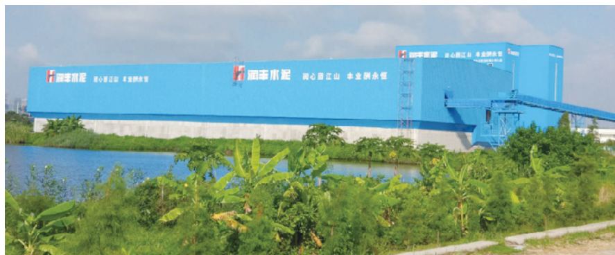
公司不断加强绿色生产建设,建设零环保事故企业

位于南沙区南沙街道的粤群混凝土公司，是央企华润集团旗下香港上市公司华润水泥下属公司。自1996年建成投产以来，公司对标华润水泥品牌建设，配置高性能生产设备，坚持创新驱动发展，注重公司管理规范，注重质量及服务，视品牌及信誉为企业生命。同时，该公司深化党建引领，有效促进党建与业务相融合，为公司提质增效稳健发展提供有利的保障。