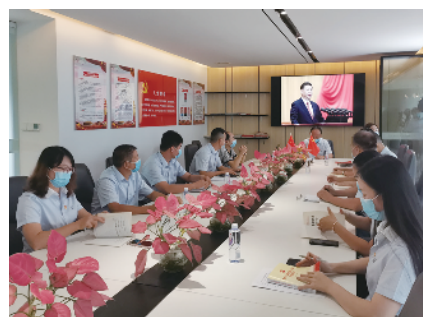
公司每月开展党员学习