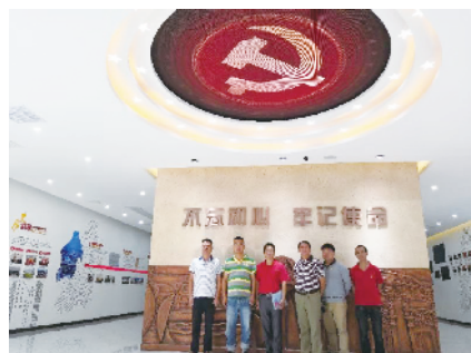
公司积极开展党员主题活动

面对疫情考验，海外高强公司党支部按照党中央的统一部署，遵循习近平总书记提出的“疫情就是命令，防控就是责任”的指示要求，全体党员迅速开展疫情防控工作。一是党员干部率先垂范，发挥模范带头作用，成立了党员先锋岗，对公司出入人员进行了排查、登记；二是以人为本，为疫情防控工作提供保障，上门为返程员工量体温、送防护用品，每天在公共场所清扫消毒；三是做好员工疫情知识普及、防控技能和防护用品使用的培训工作，增强员工防疫能力；四是经常对员工健康摸底，掌握员工的健康动态，对有到过风险区的、体温偏高身体异常的员工及时单独观察加强检测；五是联系各疫苗接种机构，大力宣传鼓励员工早日接种新冠疫苗，让员工疫苗接种率达90%以上，万众一心、众志成城携手打赢疫情防控阻击战。