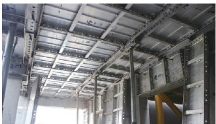
工程采用铝合金模版加固体系

市中心，而保利大都汇将作为该片区的引爆点，对促进揭阳地区产业集群、完善功能配套等具有重大支撑意义。 该项目的承建单位中建四局建设发展有限公司（简称四局发展）是中国建筑第四工程局有限公司旗下重要骨干公司，而中建四局建设发展有限公司粤东分公司（简称粤东分公司）是局属三级分公司，隶属于四局发展，多年来深耕粤东地区。2020年9月19日，粤东分公司正式成立，成为四局发展四家分公司之一。截至2021年，粤东分公司累计承接汕头、揭阳、潮州、梅州等城市共计21个项目，逐步开拓惠州、汕尾、珠海等市场。