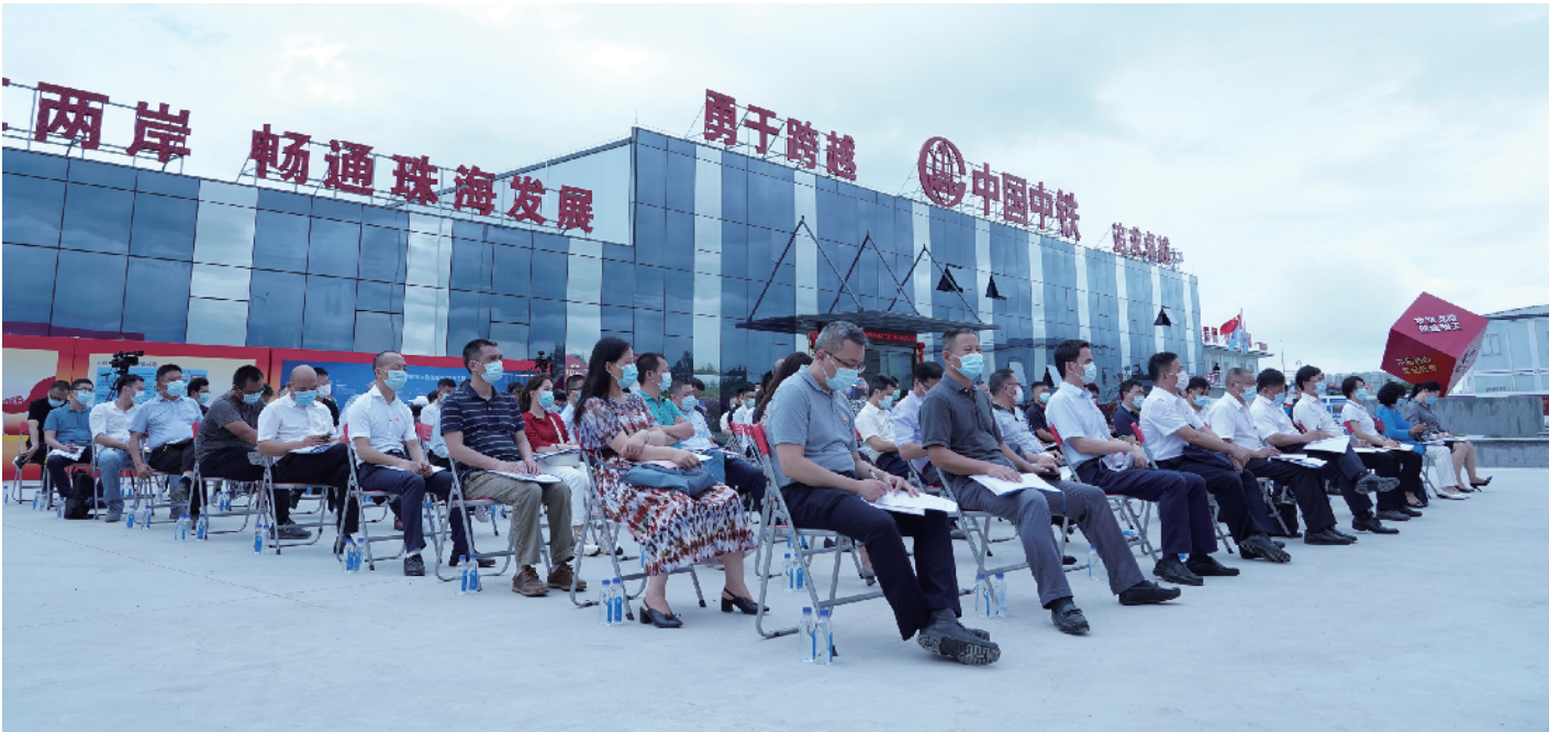
红色工地建设现场会

推项目的技术人才、工程管理人才走上项目讲习所的讲台,宣贯珠海隧道工程关键技术、质量安全管理理念,强思想意识,强技术支撑,有效保障项目顺利施工,创造良好的工作局面。