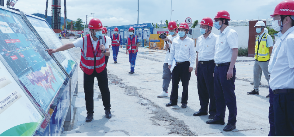
珠海市委常委、组织部长吴青川调研珠海隧道红色工地建设