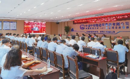
观看建党100周年盛典

“隧穿珠江两岸,畅通珠海发展”。珠海隧道工程项目位于珠海市香洲区、斗门区、金湾区三地交汇处,主线起点位于珠海大桥西(灯壳公路东侧),与珠海大道主线相接,向南转向下穿珠海大道新建辅道后转入珠海大桥南侧,以盾构段进入磨刀门水道江中段,继续向东下穿堤岸,以矿山法形式下穿挂陡山体后,向北转向接入珠海大道主线,终点位于珠海大桥东。主线全长约5.0公里,其中隧道长度约4.48公里(含盾构段2.93公里,矿山法隧道长约0.395公里,暗埋段约0.655公里,敞开段约0.5公里),主线隧道为双管单层盾构,双向6车道。项目主线隧道段和接线路段主线按城市快速路标准建设,接线路段辅道按城市次干路标准建设,项目预计2024年年底竣工。