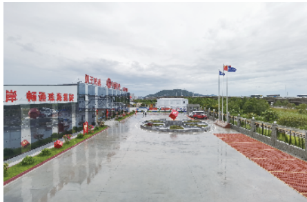
珠海隧道工程红色工地阵地

“党建+关怀”,一是创建“红色工地”党群驿站。集咖啡、茶吧、书吧、酒吧、影吧等综合体,创建一个轻松休闲的环境,释放员工压力,作为心灵健康纽带点,拉