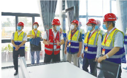
院士观摩工地智慧指挥中心