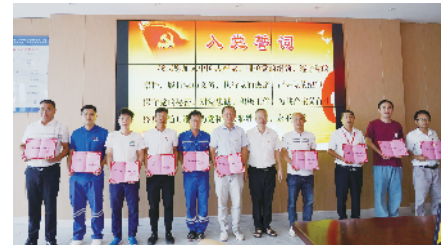
优秀共产党员表彰