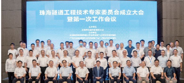
珠海隧道工程院士团队技术专家委员会成立大会

目前,项目根据施工组织安排积极推进现场施工进度。项目建设完成后,将进一步打通珠海交通动脉,加强城市东西组团间联系,推进粤港澳大湾区基础设施建设,加快珠海打造“粤港澳大湾区重要门户枢纽”的进程,满足日益增长的交通需求。