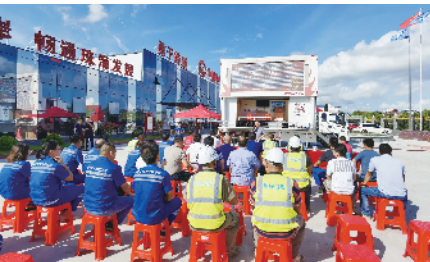
建党百年全员安全宣贯活动

“欲筑室者,先治其基础”。党支部是党的基础组织,是党组织开展工作的基本单元,是党在社会基层组织中的战斗堡垒,是党的全部工作和战斗力的基础,也是贯彻落实党中央决策部署的“最后一公里”。中铁隧道局坚持把“支部建在项目上”,将管党治党触角延伸到最前线,确保项目党建“三同步”,即项目党支部建立与项目部的成立同步、党支部班子与项目班子组建同步、党组织管理与项目管理同步,切实做到“一个支部一座堡垒”。依靠党组织把党员紧密地团结在一起,极大地增强了党员的凝聚力和向心力,有效确保了队伍团结稳定。