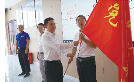
党员先锋队授旗仪式