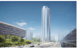
新皇岗口岸综合业务楼效果图

中建一局建设发展公司有关负责人表示，粤港澳大湾区位于我国改革开放前沿，更是经济增长重要引擎。近年来，公司积极开拓优质市场资源，在这片充满活力的热土上高质量建设深圳前海信息枢纽大厦、广州阿里巴巴华南运营中心等超高层项目，为大湾区打造一座座精品地标建筑。