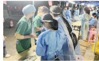
职工们奋战在抗疫一线

进“我为群众办实事”工作落地，彰显了中铁五局“路桥先锋”精神，用路桥人的“热血红”来守护人民群众的“健康绿”。 据了解，此次献血活动还吸引来了项目驻地周边的群众，他们被献血者的无私奉献和高尚品格所感染，纷纷自愿投身到了爱心献血公益事业中来。本次无偿献血活动，共有 67 人报名参加，经检查筛选成功献血 25 人，献血量达 8300mL，为抗击疫情救治伤员做出了贡献，充分展现了央企的社会责任和担当精神。