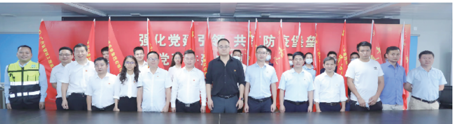
主题党日活动现场

广东建设报讯 记者誉建业、通讯员田石刚报道：4 月 25 日，广州南沙粤海地产有限公司党支部联合中建铁投轨道交通公司 EPC 事业部党支部，在粤海湾区中心二期项目开展“强化党建引领，共筑防疫堡垒”党建共建主题党日活动。双方党支部党员、项目各参建单位负责人、党员、防疫专员共计 35 人参加活动。 活动中，业主单位与监理、总承包单位，总承包单位与其他各参建单位分别签订疫情防控工作责任书，压实工作责任。双方单位负责人为各参建单位授“党员突击队”“青年突击队”队旗，激发党建团建活力，让党员干部和广大青年投身抗疫一线，在抗疫中淬炼队伍，凝聚奋进力量，打好疫情防控和优质履约攻坚战。