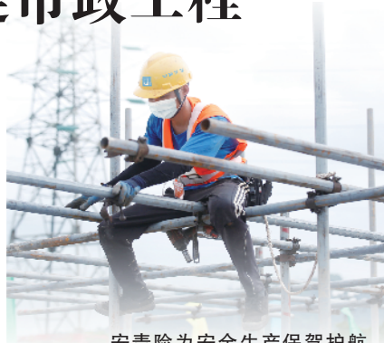
安责险为安全生产保驾护航 (资料图片)

近日,广东省住房和城乡建设厅发布了《广东省房屋市政工程安全生产责任保险实施方案(征求意见稿)》和《广东省房屋市政工程安全生产责任保险事故预防技术服务工作指引(征求意见稿)》公开征求意见的公告。 依据意见稿,市政工程安全生产责任保险(以下简称安责险)是具有“保险+服务+科技”新模式、带有公益性质的强制性商业保险。2022 年底前,实现全省所有在建房屋市政工程安责险 100%投保;2025 年底前形成建筑施工企业自觉投保,保险机构有效组织服务,保险服务信息畅通,资源共享,覆盖面广泛、适应性较强的安全生产责任保险制度体系。 意见稿指出,安责险保障范围包括投保房屋市政工程项目区域范围内,因发生生产安全事故或施工意外事故造成的从业人员人身伤亡赔偿,第三人人身伤亡和财产损失赔偿、事故抢险救援、法律服务等费用。各地住房城乡建设有关主管部门要将安责险推进工作纳入年度安全生产目标责任制考核,把房屋市政工程投保安责险情况作为日常监督管理的重要内容。对未投保安责险的房屋市政工程,要责令、督促施工企业立即参保,做到应保尽保。 全省新开工和在建的房屋市政工程,应以项目为单位参保房屋市政工程安责险。意见稿印发实施前已开工仍在建的工程项目,可按照该项目剩余工程量(造价)或剩余工期占全部的比例计算缴纳保费。