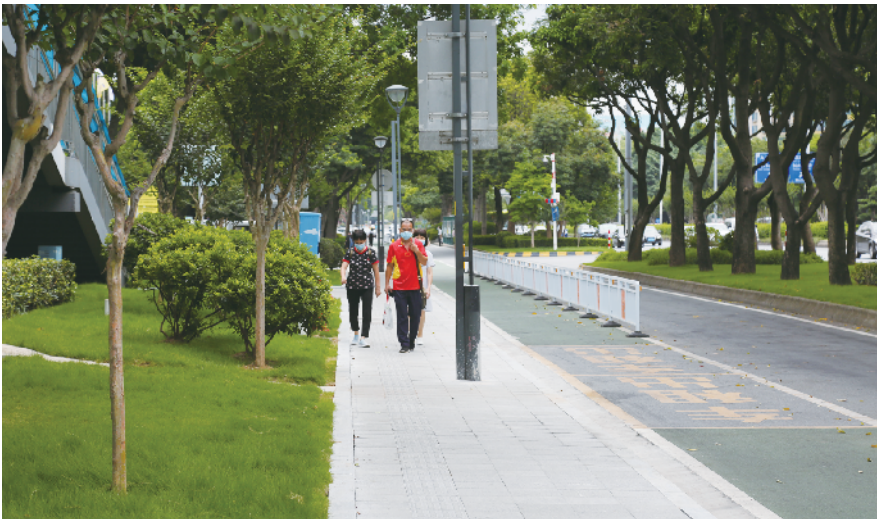
佛山大道西侧改造后

据统计，实施百日攻坚行动以来，佛山市区目前月度各平台数量不高于 20 宗，投诉环比下降 90%。截至行动结束，共投入巡查及维修人员 8190 人次，出动车辆 1308 车次，共修复人行道 19383 平方米，修复单量 10889 单。禅城区城市管理综合服务中心相关负责人说：“接下来，我们还将继续以百日攻坚行动的工作标准，持续开展我区人行道的精细化管养，实现城市管理的高质量发展。”