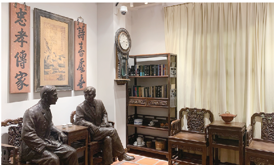
汕头市红色交通线中站旧址内还原当年情景

小公园开埠区保护活化过程中，汕头坚持修旧如旧、推陈出新，推动停滞长达十几年的小公园开埠区保育活化工作取得突破性进展，成立了汕头小公园历史文化街区保护与开发管理委员会，市人大常委会颁布了《汕头经济特区小公园开埠区保护条例》，为小公园开埠区的全面保护和活化提供了法律依据。目前，小公园开埠区第一批历史建筑已完成保护规划编制、3D建筑测绘工作，并完成挂牌保护工作。