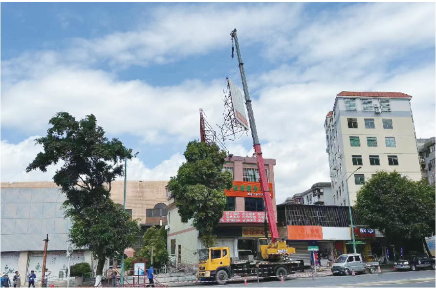
云浮区城管部门拆除存在安全隐患的户外广告

创建国家园林城市,与打造自然生态和历史文化兼具的宜居城市结合起来,全力以赴推进城市园林公园建设。截至目前,云浮市城区共建成大小公园 34 个,公园绿地面积 537.03 公顷,人均公园绿地面积 18.25 平方米,绿地面积 1288.92 公顷,绿地率 37.93%,绿化覆盖率 41.59%。远方层林尽染,近处鸟语花香。在市体育公园,功能齐全的体育设施和美丽的游园环境,成为云浮又一张靓丽的“城市名片”。