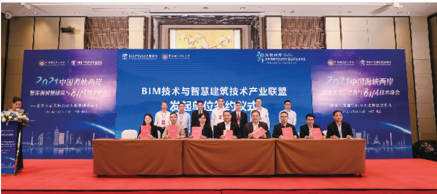
2021中国海峡两岸暨港澳智慧建筑与BIM技术峰会——暨第六届国际BIM大奖赛颁奖典礼