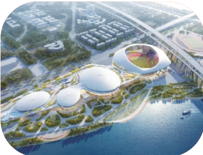
佛山市顺德德胜体育中心项目

除了提升企业的资质和荣誉,广东人信还致力于为客户提供专业的技术支持和优质的服务,立志为广东建筑业打造标杆式全过程工程咨询项目。在顺德东部新城马岗大道提升及西延线一期工程全过程造价管理服务中引入BIM技术,在工程施工前模拟出竣工后的可视化模型,直观发现项目各专业(路基、路面、排水、涵洞、交安、照明、绿化工程等)间的碰撞问题,该项目更获得佛山市工程咨询行业第五届工程造价优秀成果二等奖。此外,广东人信也完成了多个广东省内的全过程工程咨询管理项目,如:河源市新丰江(庄田)美食街及游客集散中心项目、河源市源城区东埔河老旧管网改造项目、惠州大亚湾区公安局龙山派出所建设项目等。广东人信根据多年积累的经验较为出色地完成了全过程工程咨询管理服务,赢得业主的一致好评。以品质保障、价值创造和效益优先,以做大做强全过程工程咨询业务,力争成为广东全过程工程咨询行业的引领者。