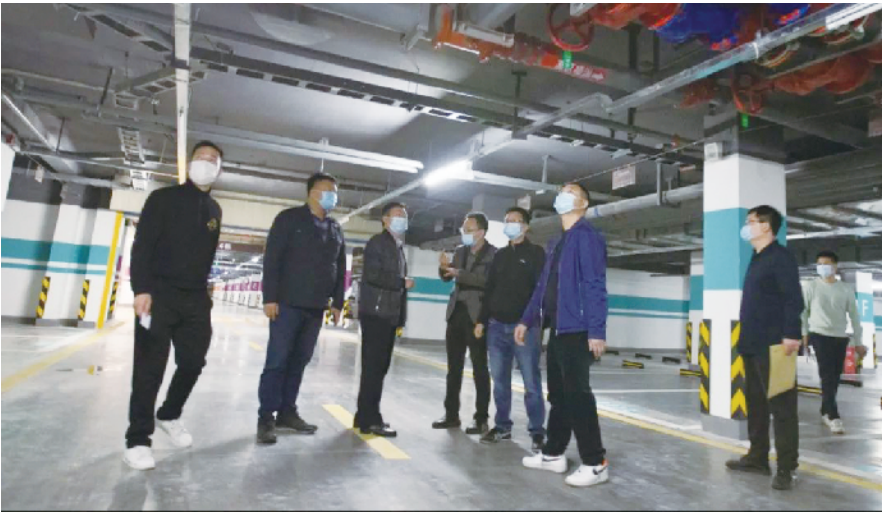
惠州不断提高消防验收“一次性”合格率,真正实现便民利企。

广东建设报讯 记者姜兴贵、通讯员罗杰报道：为进一步优化营商环境，提升消防验收服务质量，11月16日，惠州市住房和城乡建设局印发《关于开展消防施工现场前置指导服务优化营商环境的通知（试行）》（以下简称《通知》），在全省率先推出消防施工技术指