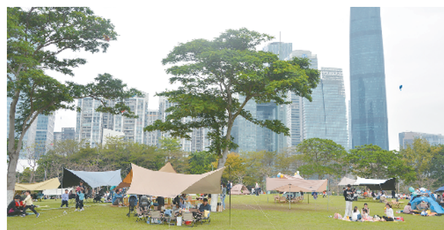
二沙岛街区游客在露营游玩

广东建设报记者近日走访了部分试点街区,采访了街区居民、商铺、游客,发现 12 个试点街区均具有建设基础较好、优势资源集中、发展潜力大的特点。