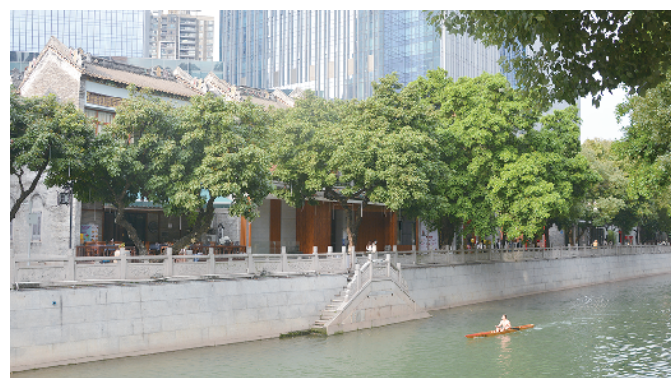
猎德街区

迈向国际化街区。广东建设报记者采访了位于海珠区广州塔街区商户范先生,他说:“近几年广州塔-琶洲这一带的商业氛围越来越浓厚,广交会期间更加热闹,外国朋友也很多,在这里打造国际化街区条件非常好。”