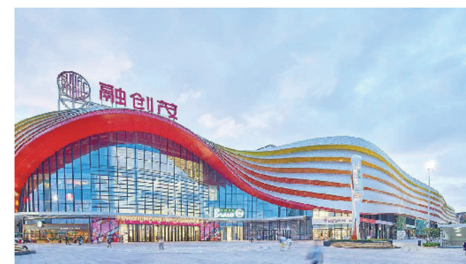
广州融创文旅城街区

作为广州旅游新邨的名片,度假区现拥有温泉、马场、中国国家版本馆广州分馆等世界一流旅游、文化等资源。从 2015 年开始,该街区每年举办从都国际论坛,是广州北部走向国际化的重要一环。