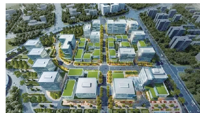
空港商贸区效果图

中新广州知识城国际人才自由港坐落于龙湖街道,是黄埔区在知识城重点建设的人才项目孵化平台之一。国际人才自由港通过构建全国首个“一核双驱多点”的人才赋能体系,创建全国首个“海外人才创新创业‘零跑动’”服务中心,建立全国首个立足于新加坡及欧洲国家的海外引才网络,打造国家级博士博士后创新示范中心,帮助海内外人才“一站式”触及区域人才、政策、金融、上下游及公共资源。