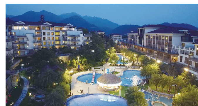
流溪温泉旅游度假区街区

祈福新邨目前港澳、外籍居民合计超过 15000 人。2021 年,该邨被列为番禺粤港澳优质生活圈示范区的核心区域。