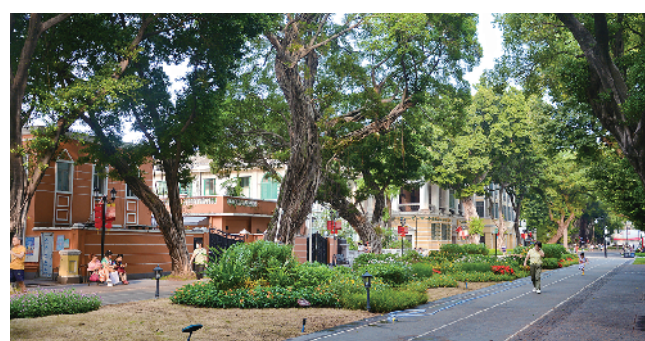
沙面街区

前来二沙岛露营的游客陈小姐在接受本报记者采访时也表示:“二沙岛漂亮又宜居,我们经常来露营,很多外国朋友也选择到这里游玩。这里作为国际化街区,可以成为广州的一张名片,也能展现出广州的美。”