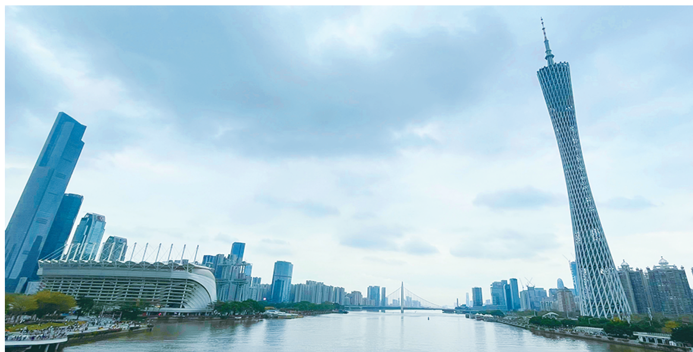
从海心桥上望去的广州塔街区与珠江新城

“这里几十年前就已经是广州最具国际化气息的地方,这些建筑的风格也以西式建筑为主,如果在此基础上再添加一些现代化的元素可能会更加出彩。”附近居民李女士在接受记者采访时表示。