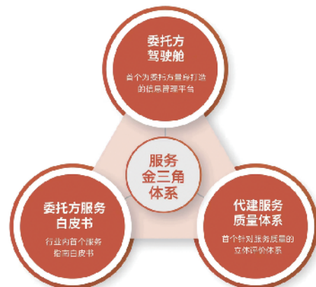
金地管理“服务金三角”体系

进度创效:仅用时133天完成桩基施工、90天完成地下室主体结构施工,塔楼施工进度达5天/层,较周边同期同类项目工期大幅缩短。