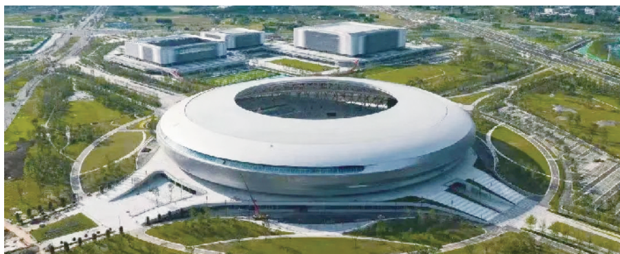
华润东安湖体育公园