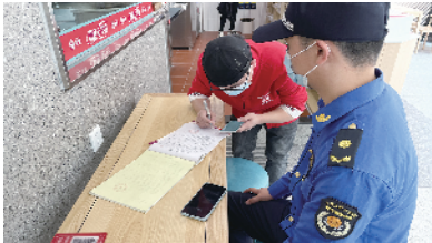
中新镇对相关单位开具整改通知单

中新镇相关负责同志表示，培训会让各层级垃圾分类工作人员深刻理解目前垃圾分类工作面临的形势，进一步提高工作人员的思想认识，明确工作分工。下一步，中新镇将继续加大检查力度，扩大检查范围，特别加大对屡教不改的责任人的处罚力度，推动垃圾分类工作落实。