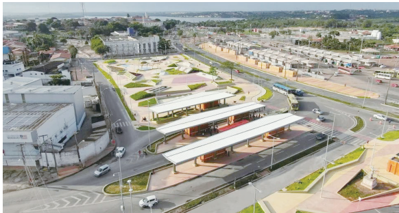
圣路易斯历史中心 巴西 / Natureza Urbana

列宁广场坐落在 Serpukhov 市的中心地带，始建于 1783 年，在当时是图拉与莫斯科通路之间最重要的商业场所之一。在两百多年间，广场经过了多次翻修改造，成为城市核心。然而，随着时间的推移，广场逐渐被混乱的停车场与售货亭占据，步行区域逐渐消失，变成了废弃的灰色地带。受莫斯科地区景观和公共空间发展部委托，Megregionstroy 事务所对广场进行了改造设计，并于 2020 年顺利落成。改造的核心理念旨在恢复广场的社会凝聚力，打造人性化的城市公共空间。设计的目标是使广场成为一个富有吸引力的娱乐场所。从广场出发，人们可以休闲地漫步至周边的城市花园，花园里设有喷泉、纪念碑、花坛、雕塑以及儿童游乐场。