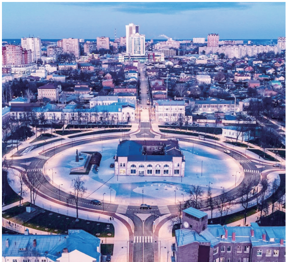
列宁广场改造 俄罗斯 / Mirror

本报选取多个国外城市更新设计经典案例进行解读，展示国外设计师如何让老旧建筑重焕生机，实现更有温度的城市更新。