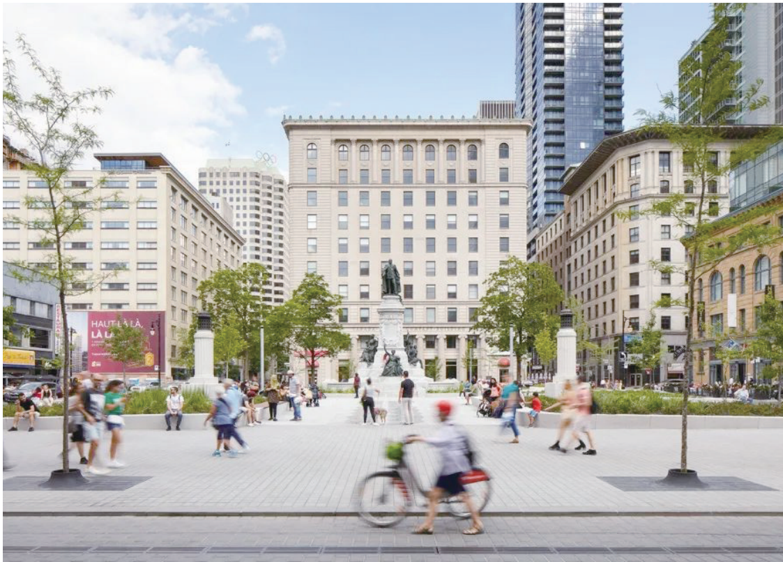
圣凯瑟琳大街西段更新

马拉尼昂州首府历史城区的振兴计划由泛美开发银行（IDB）提供资金支持，包含了一系列改造和建造项目，其中有 3 个重要的改造项目由 Natureza Urbana 事务所率领完成，包括“慈悲广场”（Mercy Square）和“萨乌达德广场”（Saudade Square），以及位于 Vitorino Freire 大道巴士站附近的“主教喷泉”（Bishop's Fountain）区域。