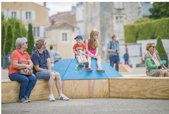
Imaginons Poitiers 装置

造了一条绵延六个街区的慢行系统，步行街两侧为历史悠久的百货商店，并将该地区与周围环境融为一体。除此之外，事务所还对菲利普斯广场进行了扩建，为这座城市打造了一处全新的绿色公共枢纽。