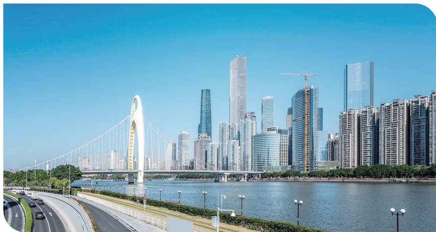
广东目前正大力推动安全生产监管信息化建设

除在安全生产月举办系列活动外，今年来，省住房城乡建设厅不断加强部署房屋市政工程安全生产治理行动巩固提升工作，推动安全治理模式向事前预防转型，着力提高房屋市政工程本质安全水平，稳控安全生产形势，维护人民群众生命财产安全和社会大局稳定。