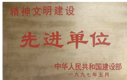
精神文明建设先进单位

广东六建在佛山市场已经耕耘了70年，有充足的市场经验、健全的管理模式，每一个项目的建设过程，广东六建都深度介入，实现精细化管理，贯彻执行每一项规范标准，无微不至，对于项目的每一个具体环节的施工质量都有实实在在的把控。在70年征程中，品质始终作为广东六建提供建筑服务的价值和承诺，保障建筑品质，不仅是建筑师和建筑工人的职业操守的要求，更是广东六建对建筑行业的庄严宣誓。展望未来，广东六建将继续秉持安全第一的生产原则和以品质为重、追求卓越的工作理念，追求建筑品质的高质量发展，为客户提供更好的产品，为社会作出更大的贡献。