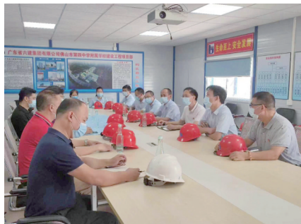
公司领导检查项目工地