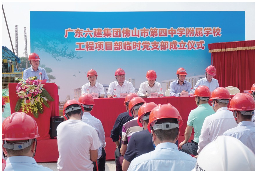
工地临时党支部成立

此外，广东六建近年来开始要求各分公司及其项目部的职能部门每个月要上报在建工程的重大危险源给总公司的相应职能部门，技术部门要上报给技术质量中心，安全生产部门要上报给安全生产中心。例如，下个月的某一个生产阶段涉及到塔吊安装，或者塔吊拆卸，或者施工升降机安装拆卸，又或者有深基坑、有高支模、有大型吊装等重大危险源，则全部需要在本月内提前上报。与此同时，对于可能涉及质量问题的内容，各项目