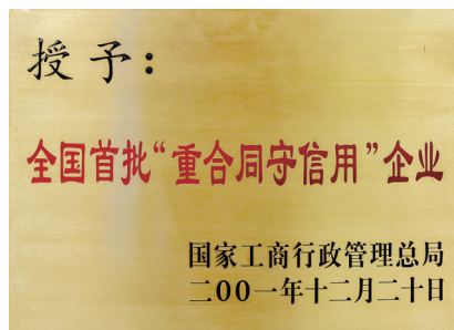
全国首批重合同守信用企业