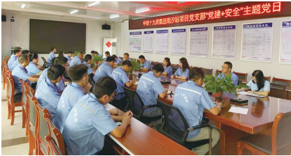
▲党建+安全主题党日

奋斗成就过往，奋进正当其时。目前，南沙站综合交通枢纽地铁预留工程正在马不停蹄地进行车站主体结构施工。其势已成，其风正劲。中铁十九局建设者将以高质量干好南沙站的实际成效，在“轨道上的大湾区”展示中国铁建的铁军雄风，为加快建设交通强国交出一份优异答卷。