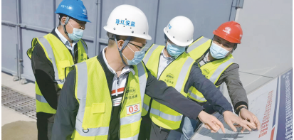
▲安监领导现场检查