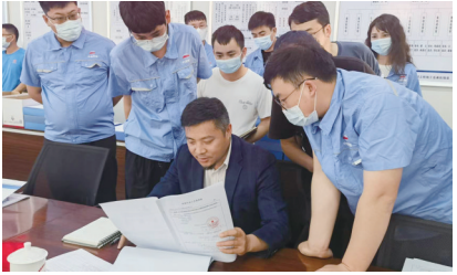
▲省考核组检查内业资料