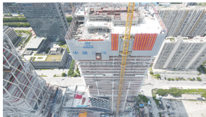
三七互娱全球总部大厦

广东建设报讯 记者陈克正,通讯员肖庆稀、周传建报道:8月8日,随着封顶仪式推杆的缓缓推下,最后一方混凝土顺利浇筑,由中建二局承建的“互联网20强企业”新家——三七互娱全球总部大厦主体结构全面封顶,为项目竣备交付奠定坚实基础。