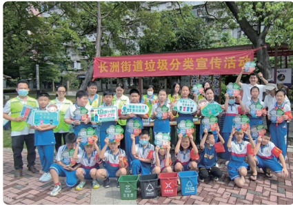
长洲街道垃圾分类宣传活动现场

广东建设报讯 当前正值暑假，广州市黄埔区多个街道纷纷通过组织学生做垃圾分类宣传志愿者，举办垃圾分类主题活动。全区掀起了“小手拉大手”的垃圾分类实践宣传热潮，以垃圾分类为切入点抓好学生素质教育，契合“双减”政策，提高学生垃圾分类意识以及参与垃圾分类的积极性，同时带动身边居民共同参与垃圾分类，推动垃圾分类成为低碳生活新时尚，积极响应了深入践行习近平总书记给上海市虹口区嘉兴路街道垃圾分类志愿者的回信精神。 本次参加活动的志愿者涵盖辖内的大学生、中学生及小学生。活动开始前，社区垃圾分类专管员发出招募通知，组织志愿者参加培训，学习垃圾分类知识和沟通技巧。经过一系列的精准培训，身穿橙色志愿马甲的青少年垃圾分类志愿者正式上岗，成为小区里一道独特的风景线。 红山街道： “垃圾分类小手拉大手” 近日，红山街道火电社区率先启动“垃圾分类小手拉大手”学生志愿者站桶活动，引导居民做好源头分类。 “这样的活动非常好，不仅使孩