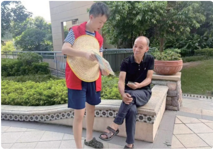
长岭街道山景城社区青少年发放垃圾分类宣传资料