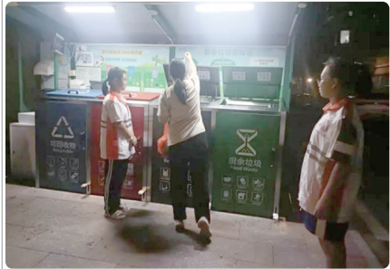
红山街道火电社区学生志愿者引导居民做好源头分类