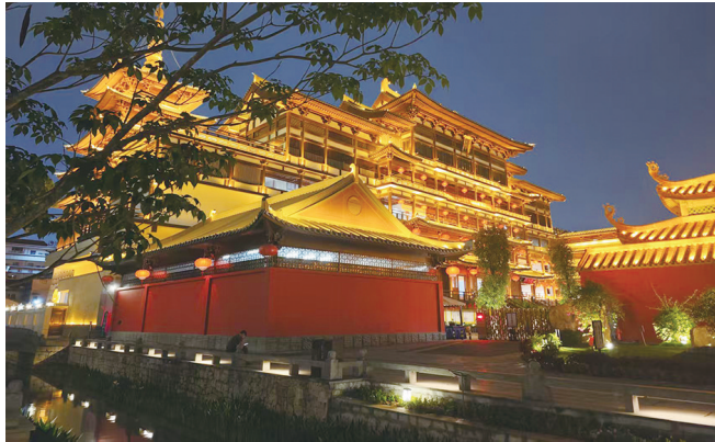
揭阳古城 双峰寺

本次招标范围涵盖项目全流程施工内容。其中，新建地下停车场工程共一层，建筑总面积约为20000平方米，停车位约500个，可有效缓解周