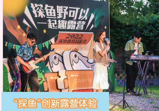
“探鱼”创新露营体验

8月23日，烤鱼美食品牌“探鱼”在广州海珠举办以露营为主题的品鉴会。根据露营场景的便捷用餐需求，准备了烤鱼、美味小吃、人气饮品等产品，以全密封外卖+现场点火复热的形式，将堂食吃烤鱼的体验原样搬到户外，令外卖露营套餐美味又出片。活动现场还设置了冰粉DIY专区，邀请歌手与乐队现场演奏助兴，用音乐点燃现场气氛，让大家沉浸式体验户外美食品鉴的乐趣。探鱼广州负责人现场介绍，探鱼产品在保留经典招牌产品的基础上，加入了许多创新性的融合类菜品、以及互动性的创意产品。（文/曾敏妍）