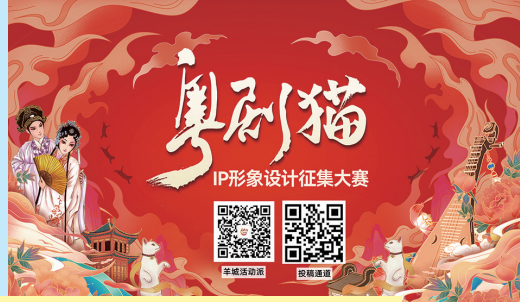
“粤剧猫”IP征集大赛@你

即日起至10月15日，粤剧艺术跨界新尝试——“粤剧猫”IP征集大赛上线！通过粤剧与潮流文化相结合，粤剧、艺术、动漫、数字创意、设计多行业融合，打造具备社交属性的“粤剧猫”IP形象。本次大赛由羊城晚报报业集团、广东省繁荣粤剧基金会共同主办，得到广东粤剧院、红线女艺术中心、广州美术学院视觉艺术设计学院（冰墩墩设计团队）、广东女子职业技术学院应用设计学院、广东省女画家协会、广东省动漫艺术家协会、广州动漫行业协会、广州市数字创意产业协会的顾问指导。想知道更多赛事资讯及报名渠道，可关注微信公众号“羊城活动派”。（文/曾敏妍）