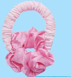
大肠橡胶型卷发器