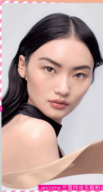
Lancome兰蔻持妆无暇粉底

户外野餐最容易受到汗水、出油的双重打击。与其被动变成“花面猫”,不如先防范于未然。清透是春日野餐妆容的一大要点,为咗避免油光满面,大家应尽量选无油、哑光效果的粉底。专门防脱妆的手法,我哋可以学美妆博主“GOSS大叔”的“三明治底妆法”:先根据肤质选择隔离霜,调节面部肤色;再上散粉,将皮肤上的大毛孔填平,方便后续粉底与皮肤更加贴合,增强持久度;最后係上粉底,呢个时候,上妆粉量係越少越唔容易脱妆,所以我们先用美妆蛋薄薄铺上一层,再二次加强面部中心,将粉底压入肌肤中,就完成了持久清透的底妆啦。