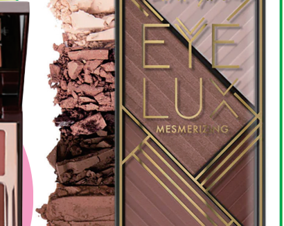
CT pillow talk眼影盘