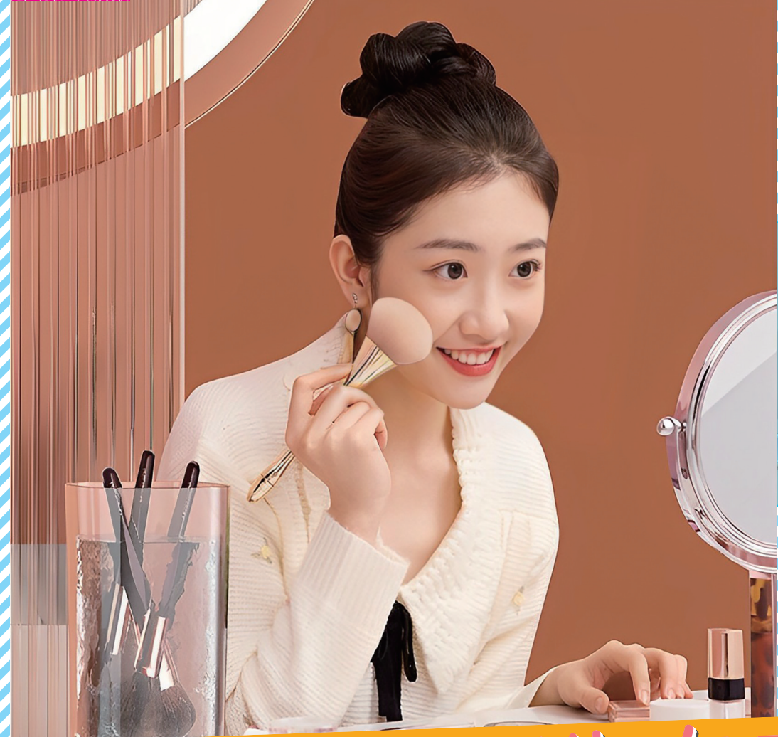
超声波工具清洗机

日常都有化妆的朋友,唔单止要选啱自己、用起来顺手的化妆工具,仲要经常清洗,保证佢哋足够干净。因为化妆工具係直接同化妆品、我们的肌肤“贴贴”的,化妆品残留在工具上,日积月累再同肌肤接触,容易引起过敏、皮炎等皮肤问题,咁就得不偿失了。现在生活越来越精细,连化妆工具都有咗自己的清洁器,自动、手动任君选择。快啲嚟帮佢哋洗白白啦!