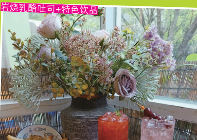
岩烧乳酪吐司+特色饮品