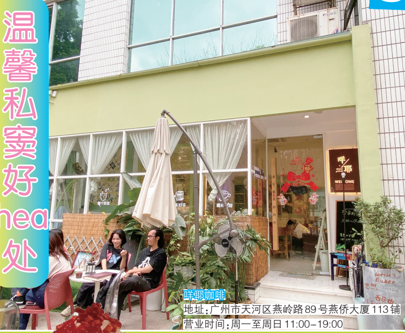
地址:广州市天河区燕岭路89号燕侨大厦113铺 营业时间:周一至周日 11:00-19:00