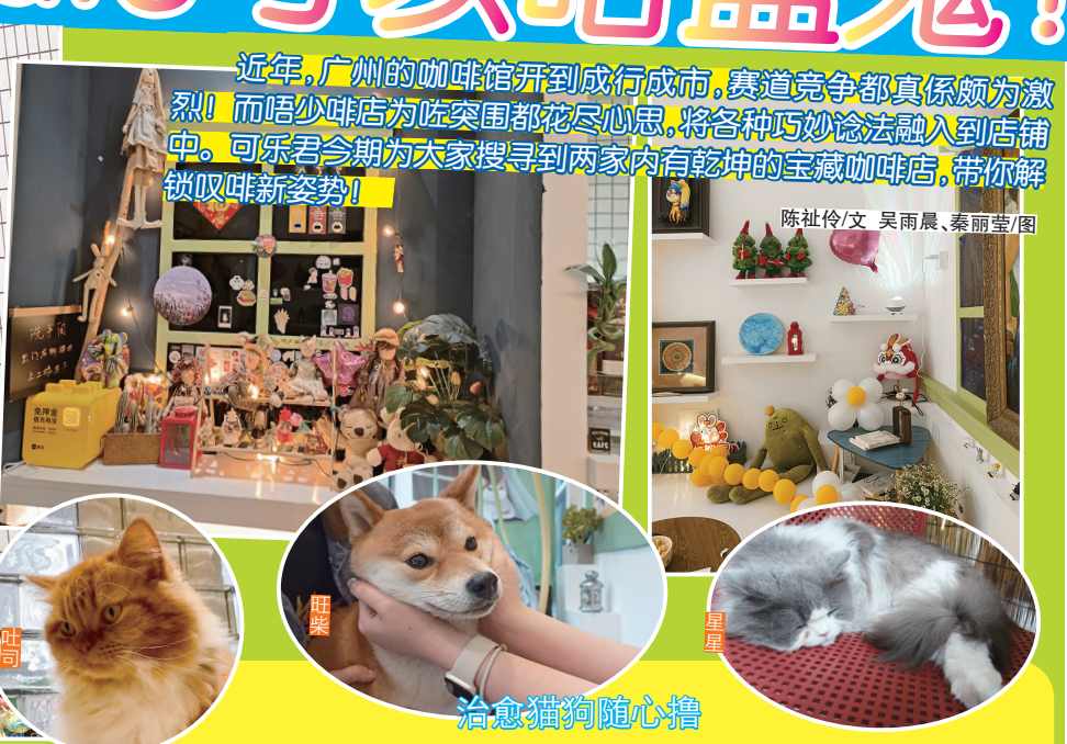
陈社伶/文