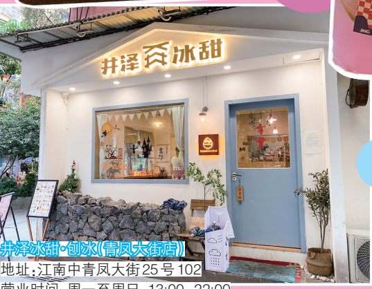
井泽冰甜·刨冰(信义街分店) 地址:江南中街大街25号102 营业时间:周一至周日 13:00-22:00

店内的装饰主打原木暖色调系,可爱的动物玩偶布满店内各个角落,配合暖色光线,鼻尖时而飘来阵阵香甜的烘焙气息,更是让人感到人间烟火的温馨甜美。刨冰店叫“井泽”,竟然仲有段古。因为当年店铺创办人和几个姐妹去日本轻井泽旅游时,尝到当地极具特色的刨冰,回国之后仍然念念不忘当初那个味道,为此她们特意闭关研习,日式刨冰制作方式都研究得多,要想刨冰外观晶莹剔透,入口又能蓬松绵密,冰块就要刨得极细而且温度还不能太低,真係十分考验师傅的功夫。数月之后才有了现在的“井泽冰甜”。