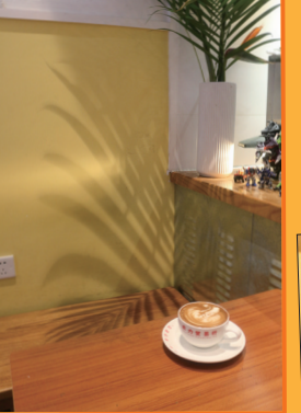
林雪BB Sweet Lam Baby