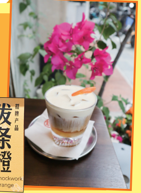
发条橙 Chickadee Orange