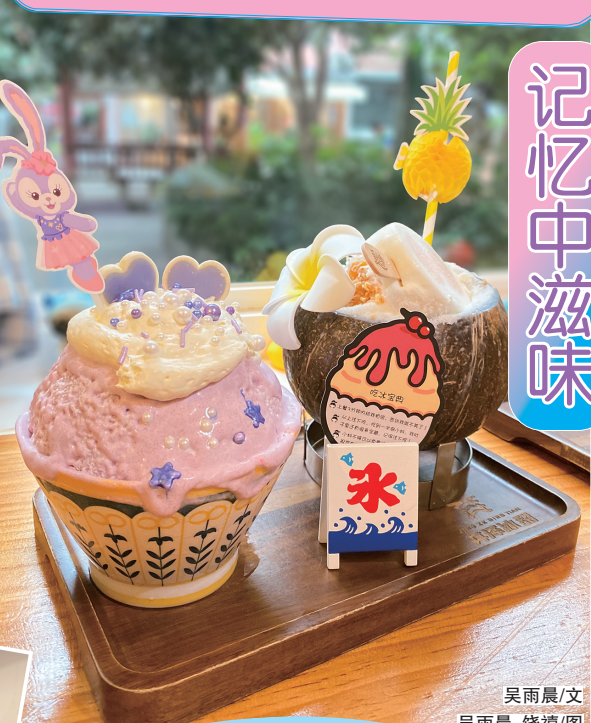
吴雨晨/文 吴雨晨、饶耀/图